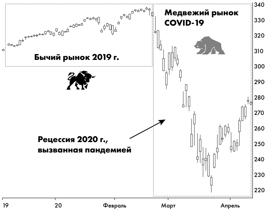
Рисунок 1.2. Сравнение растущего (бычьего) рынка 2019 года и падающего (медвежьего) рынка 2020 года по цене акций 500 крупнейших компаний США. Эти компании отслеживаются индексом S&P 500 и торгуются в биржевом инвестиционном фонде SPDR S&P 500 ETF Trust [тикер — SPY (далее тикер будет помещаться в квадратных скобках после названия компании, — прим. переводчика)]. Для справки: S&P означает Standard & Poor’s, один из индексов, использующихся для отслеживания такой информации.

Самая недавняя рыночная волатильность, конечно же, связана с пандемией COVID-19, которая привела к тяжелой глобальной рецессии (см. рисунок 1.2 ниже).