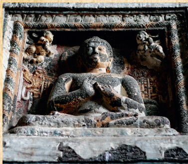
Древняя статуя Будды Пещера Аджанта, Индия

Буддизм — самая нерелигиозная из мировых религий. В буддизме