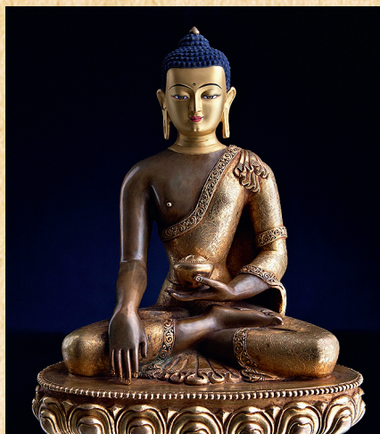
Статуя Будды Шакьямуни Тибетская традиция