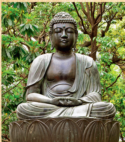
Статуя Будды Шакьямуни Японская традиция

Именно поэтому в мире существует много разных «буддизмов». Благодаря активности японских учителей XX века мы многое узнали о буддийской школе Дзэн; нам знакомо словосочетание «тибетский буддизм»; многие читали также о Южном и Северном