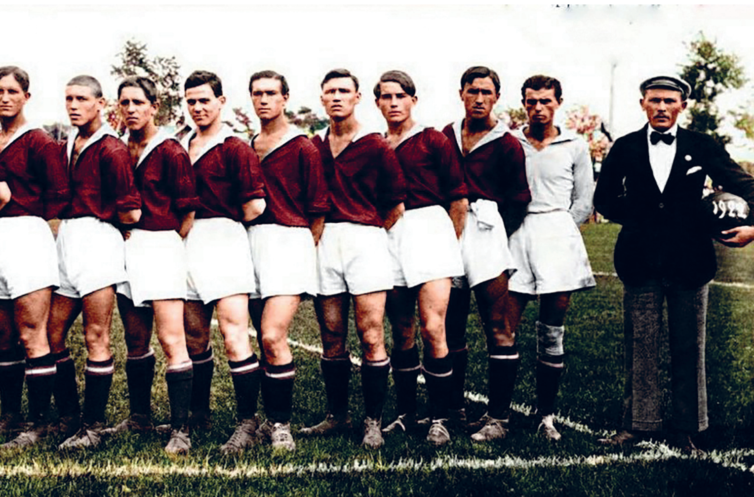
1922 год. Команда «Московский кружок спорта»

Пловдив и Плевен, венгерские Кишкёрёш и Ньиредьхаза, словацкая Миява, чешские Рыхнов-над-Кнежной и Сезимово-Усти.