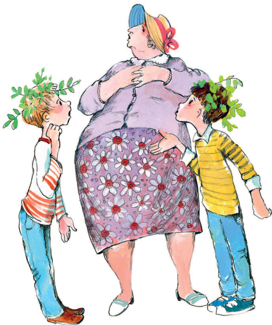
Рисунки Н. Кондратовой