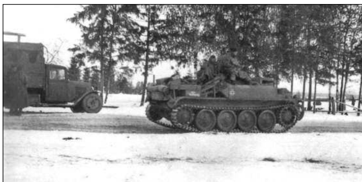
Огнемётный танк PzKpfw.II (F) «Фламинго» – вполне возможно, принадлежащий 101-му огнемётному танковому батальону.

ской тяге) и одного тяжелого со 150-мм тяжелыми полевыми гаубицами. Также в состав дивизии входил 1-й мотоциклетный батальон, 4-й разведывательный батальон, 37-й противотанковый батальон, 37-й саперный батальон, 37-й батальон связи и тыловые подразделения.