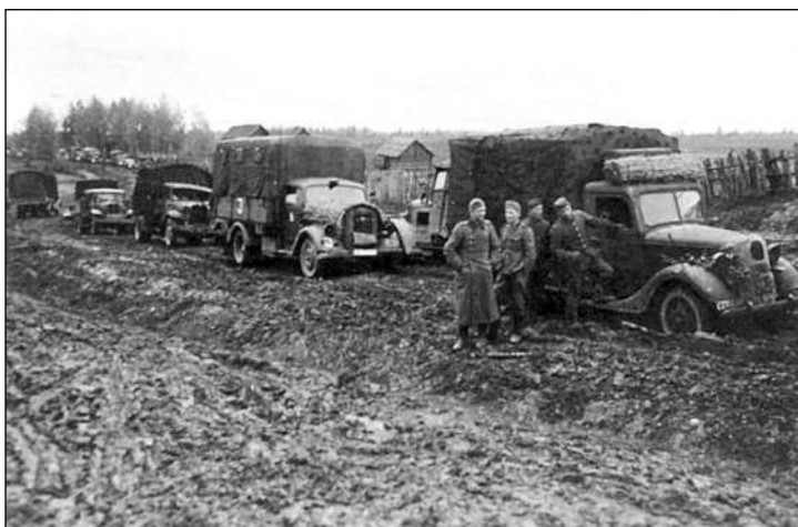
Грузовики 900-й моторизованной учебной бригады преодолевают дорожную грязь, октябрь 1941 года.

динения, на Калинин вовсе не было единодушно одобрено германским командованием. С ним не был согласен и начальник штаба 4-й танковой группы генерал Шарль де Боло, впоследствии утверждавший, что «Московская битва была проиграна 7 октября» 1 из-за того, что 3-я танковая группа не была брошена в наступление непосредственно на Москву.