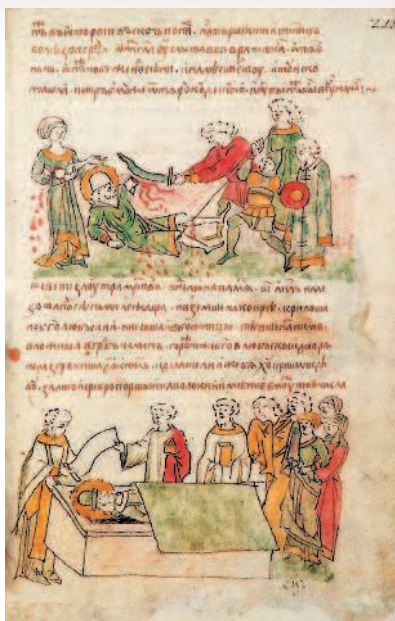
«Убиение Андрея Боголюбского». Миниатюры из Радзивилловой летописи

Владимире, собрал рать и пошел к воротам Суздаля. «А ну, — закричал Андрей, — выдайте-ка мне Улиту и братьев, покарать я их хочу». И открыли суздальцы ворота, потому что были трусы. И порубил князь Андрей братьев Кучек на мелкие куски. А Улиту бросил в отхожую яму, такую же черную, как ее сердце, да будет гнить она там вечно. Но показалось этого Андрею мало. Собрался Андрей в поход на родное село братьев Кучек. И пришла рать Андреева на берег большой реки. И смотрит Андрей вокруг, и видит семь холмов красивейших. И расхотелось Андрею жечь и грабить, а решил он заложить на этом месте лучший город на земле и назвал его Москва.