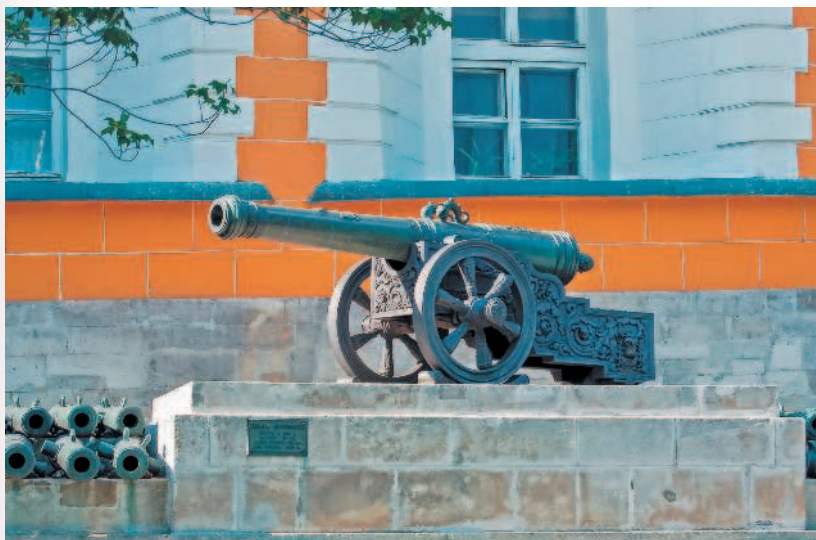
Пушки у стены Арсенала

Следующим зданием по левую руку будет Сенат . Так здание традиционно назы-