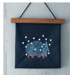
Настенное панно «Зимний лес» с. 17