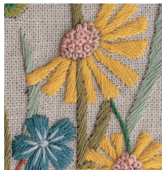
Панно с луговыми цветами с. 6