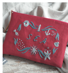
Косметичка на молнии с. 37