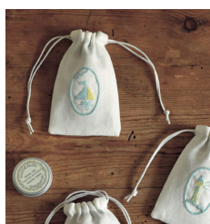
Мини-мешочки с. 32