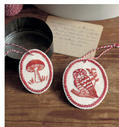
Бирки с. 29