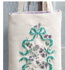
Сумочка с. 9