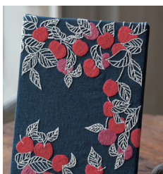
Яблоки с. 27