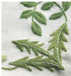
Прямоугольная салфетка с вышитыми листьями с. 7