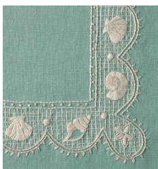
Кружево с ракушками с. 35