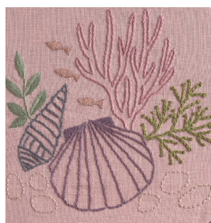
Ракушки с. 34