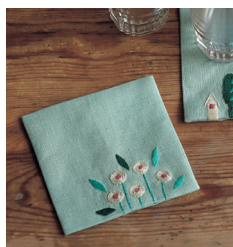
Подставки под стаканы с. 26