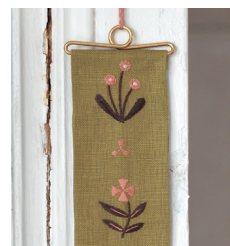
Подвесное панно с. 13