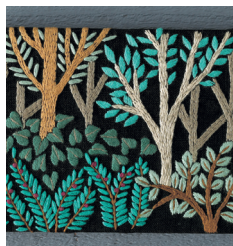
Панно «В самом сердце леса» с. 22