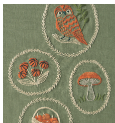
Осенний лес с. 28