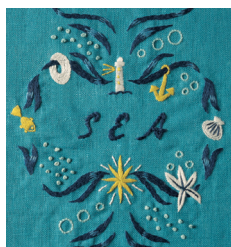
Морская композиция с. 36