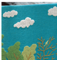
Панно с белыми облаками с. 14