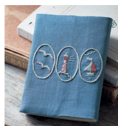
Обложка для книги с. 33