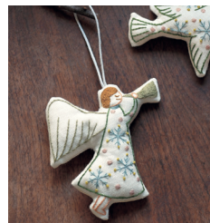
Рождественские украшения с. 25