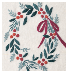
Рождественский венок с. 24