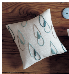
Игольница с узором «Капли дождя» с. 16