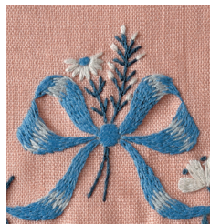
Композиция из мелких цветов и лент с. 8