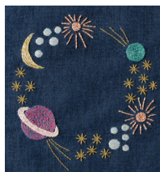
Вселенная с. 20