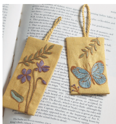
Закладка для книг с. 11