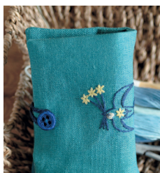
Игольница с вышитыми ласточками с. 15