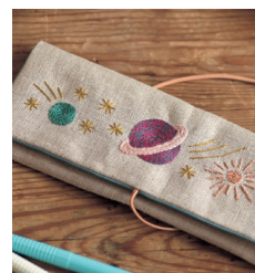
Пенал «Вселенная» с. 21