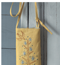
Сумочка для телефона с узором «Звездное дерево» с. 19