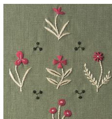
Маленькие красные цветы с. 12