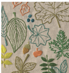
Листопад с. 23