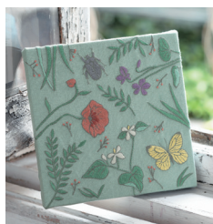
Сад с. 10