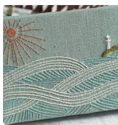
Панно «Маяк» с. 30