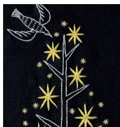
Звездное дерево с. 18