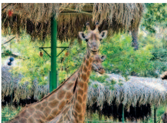
В зоопарке Хошимина