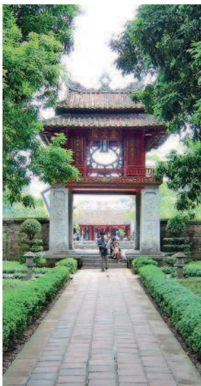
Ханой: храм Литературы

7–8-й день. После ночного переезда вас встречает величественный Хюэ. Один из дней в Хюэ целесообразно посвятить знакомству с достопримечательностями в центре города (в первую очередь стоит увидеть Императорскую цитадель), а на следующий день можно отправиться на осмотр гробниц императоров.