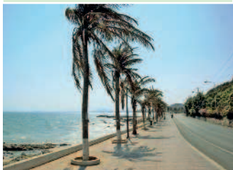
Вьетнам омывается Южно-Китайским морем