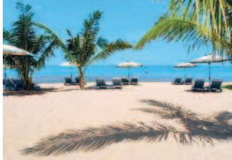
Вьетнам — это песчаные пляжи...