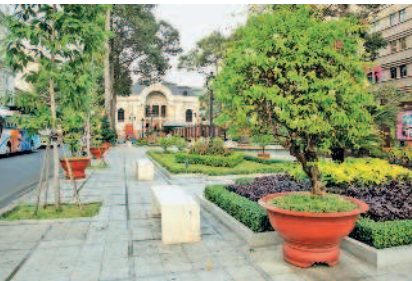
Сквер у Оперного театра в Хошимине