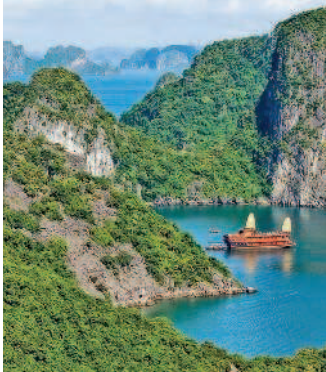
... и горы