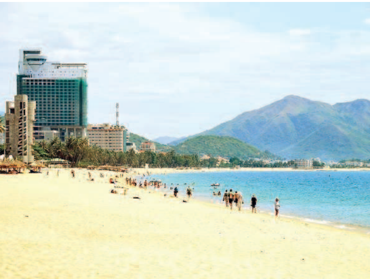
Пляж в Нячанге

10-й день. Перед вылетом стоит наведаться на рынок Dong Xuan Market и побродить часок в его рядах в поисках сувениров, специй, фруктов, футболки с актуальным принтом или чехла для своего iPhone.