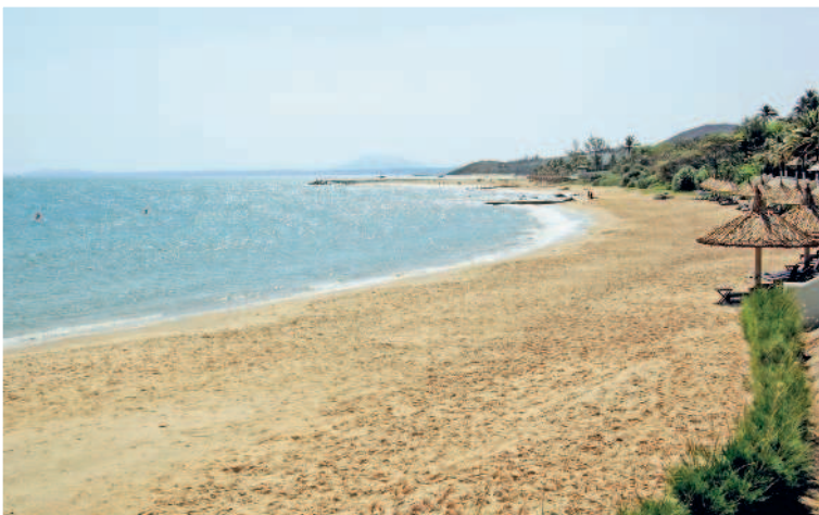
Пляжная полоса Муйне

10-й день. Если время до выезда в аэропорт и знакомство с далатским вином, произошедшее накануне, позволяют, возьмите экскурсию к экзотическим островам в окрестностях Нячанга. Если времени мало, то проведите день на городском пляже. В этот день нужно хорошенько накупаться-назагораться, а особо забывчивым – и пробежаться по сувенирным магазинчикам перед посадкой на самолет.