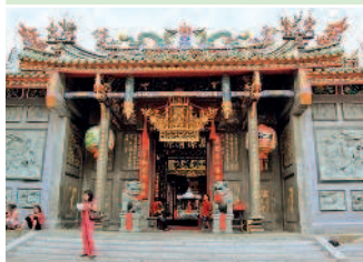
А где-то — и Китая