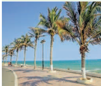
Набережная в курортной зоне Муйне