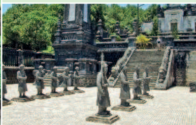
Императорские гробницы, Хюэ