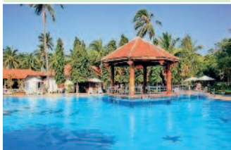
Во Вьетнаме появляется все больше фешенебельных курортов