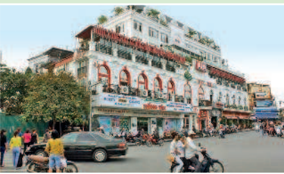
На улицах Ханоя