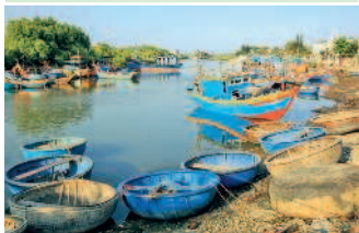
Пейзаж в рыбацкой деревеньке