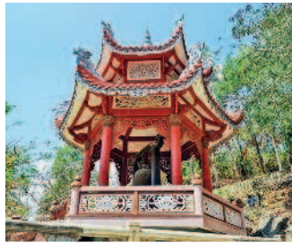
Пагода Лонгшон в Нячанге