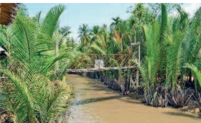
Канал в дельте Меконга

14-й день. Оставшееся перед вылетом время посвятите изучению достопримечательностей Хошимина – посетите музей истории Вьетнама и зоопарк, пагоду Нефритового императора и пагоду Винь Нгием. После столь насыщенной программы десятичасовой перелет наверняка промелькнет для вас как одно мгновение.