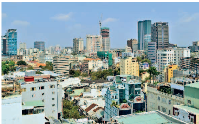
Вид на Хошимин

5-й день. Прощаемся с Хошиминим и выезжаем в город Фантхьет, точнее, в его район Муйне. Здесь вы сможете либо провести пару деньков на пляже, либо взять уроки винд- или кайтсерфинга. А можно заняться из-