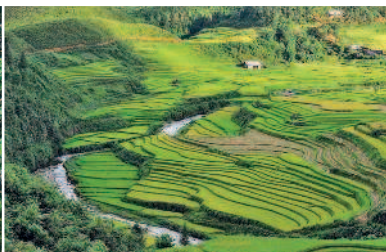
Рисовые террасы Сапы