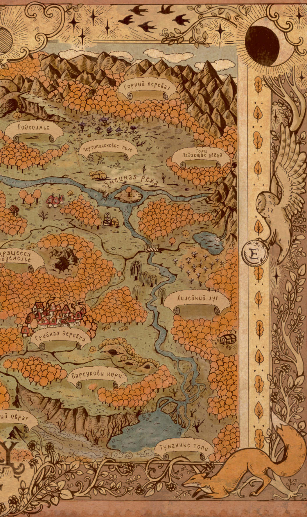
Карта Янтарного леса