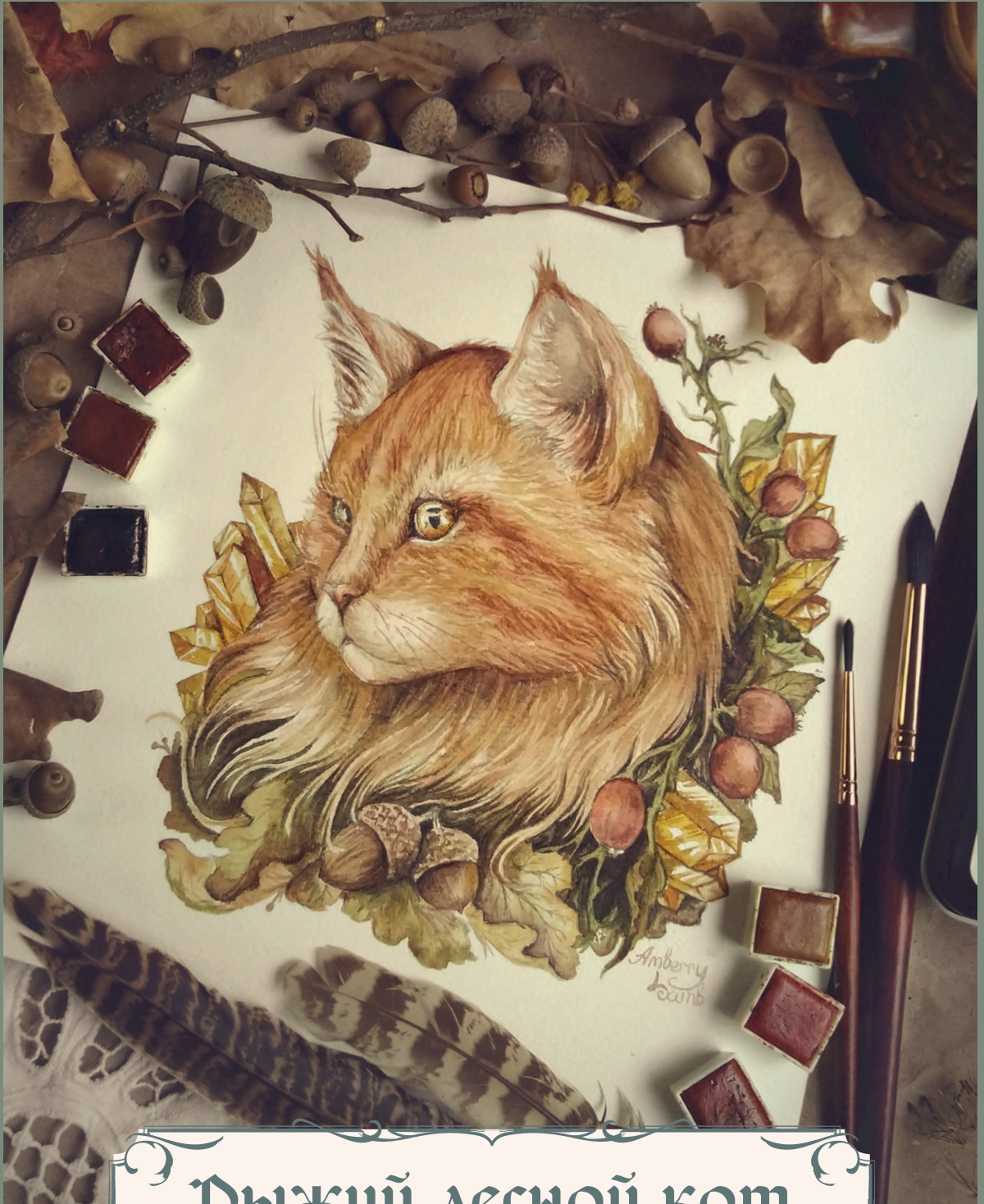
Рыжий лесной кот