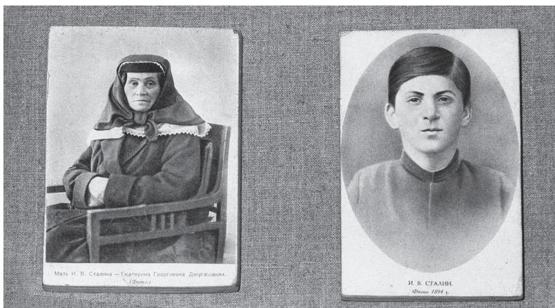
Слева — мать И. Сталина Екатерина Джугашвили, справа — 15-летний Сосо (уменьшительное от Иосиф) Джугашвили.