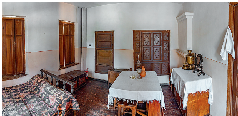
Интерьер дома, где родился Сталин, Гори, Грузия