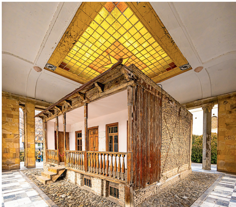
Дом, в котором родился Иосиф Джугашвили, ныне здание Музея Иосифа Сталина в Гори, Грузия. Именно здесь Иосиф провел свое детство