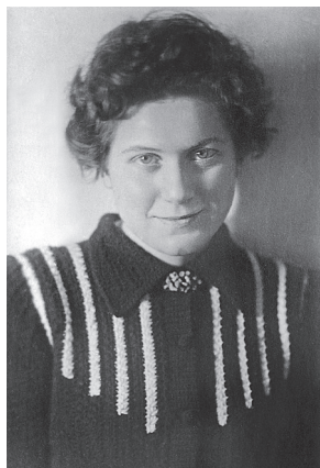
Дочь И. В. Сталина Светлана Иосифовна Аллилуева (1926–2011).