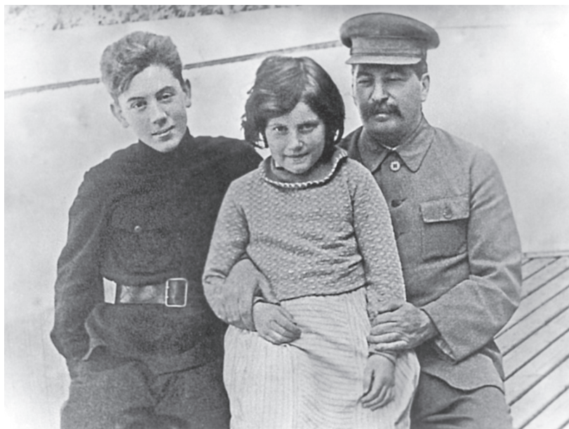
И. В. Сталин со своими детьми — Светланой и Василием. 1930