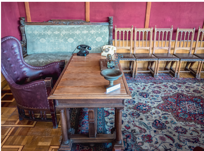
Телефон Сталина, пепельница, письменные принадлежности, письменный стол и другая мебель. Музей Сталина в Гори, Грузия