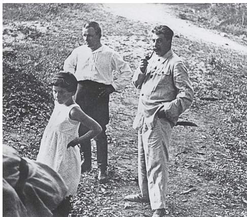
Иосиф Виссарионович Сталин, Сергей Миронович Киров и дочь Сталина Светлана Аллилуева. 1930