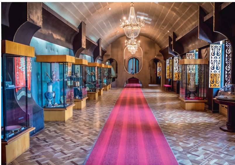
Музей Иосифа Сталина в Гори, Грузия