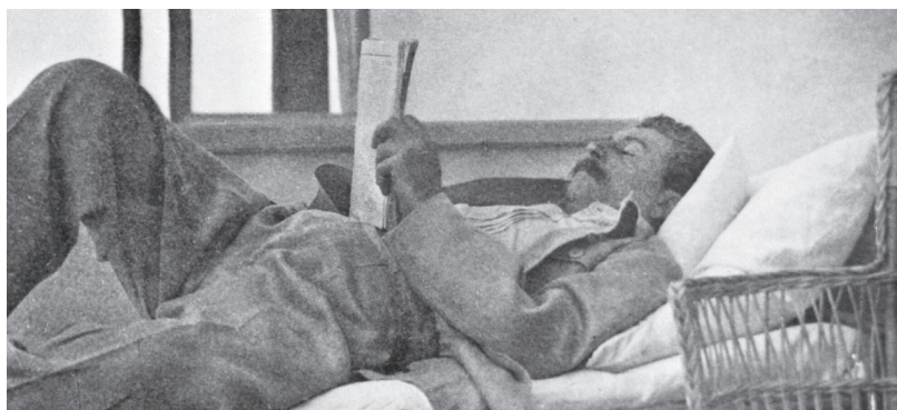
Сталин читает. 1930.