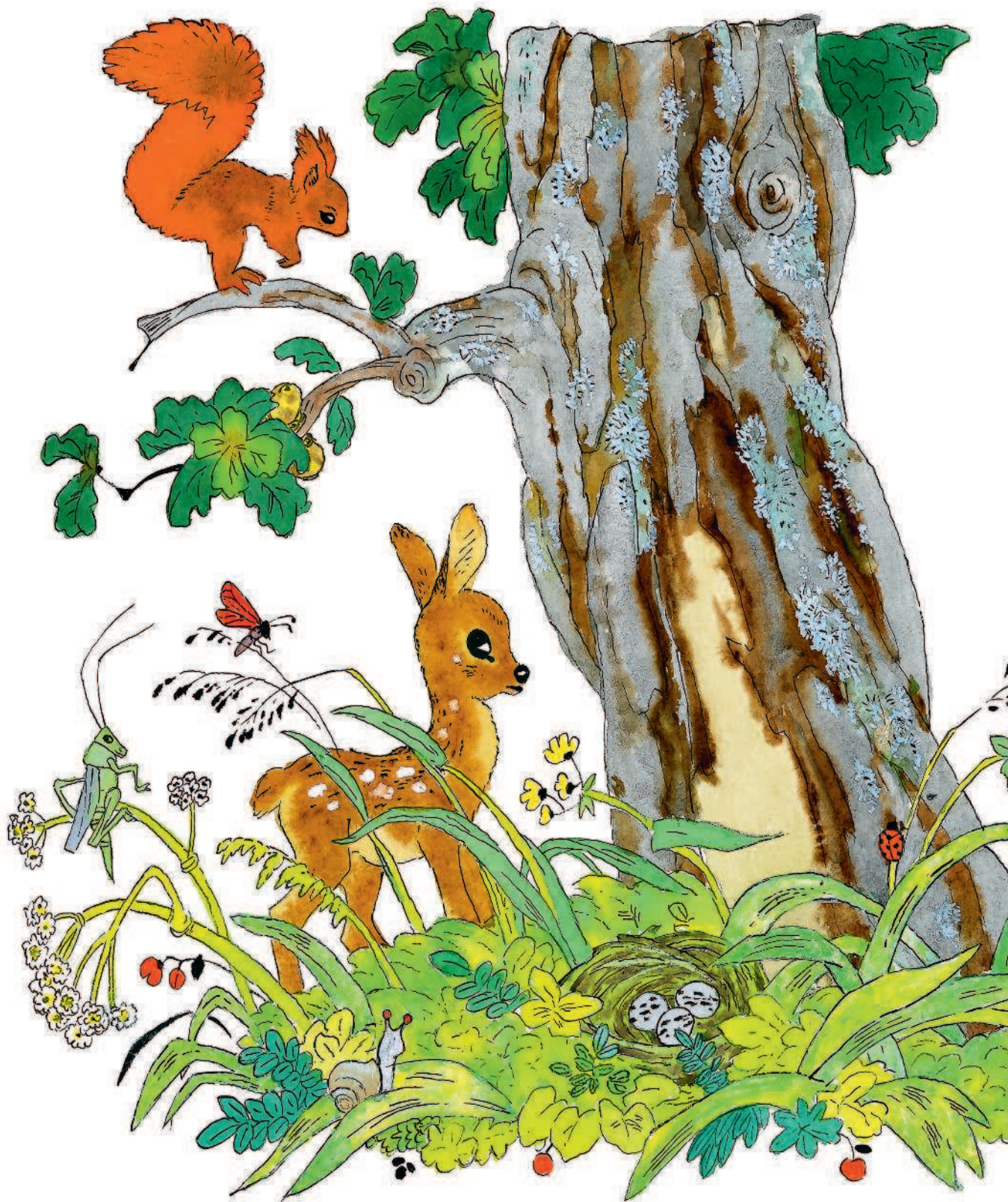
Рисунки Э. Булатова и О. Васильева