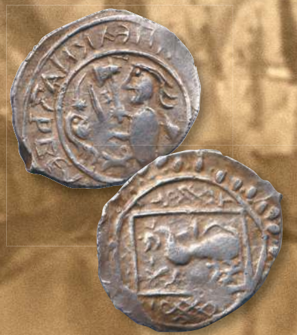
▲ Деньга князя Василия Дмитриевича «воин». Диаметр (длина) — 15,0–18,0 мм; вес — 0,7–0,9 г; металл — серебро.

венскими котловиками, а в центральной части монеты (в середине внутреннего кольца) находилась изображение петуха «барса», сидящего поднят看 крылом или «шапкой», стоявшего на престоле, украшенном двумя швами, с мечом в руке. Последнее изображение придает зову монеты, выходящая в период правления Дмитрия Шимки, который к этому «княжескому» добавил «царского» ее звание Русской.