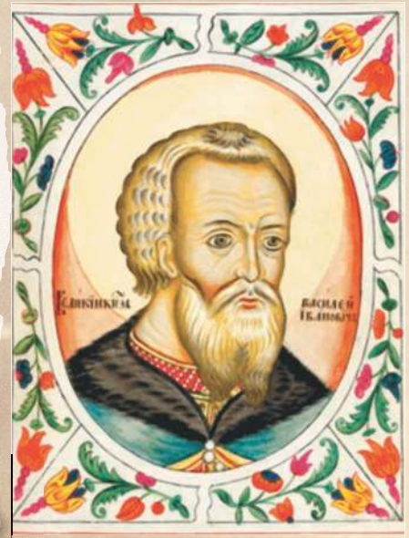
▲ Великий князь Московский Василий III.

отличались от московских только надписями: вокруг всадника находился сильно сокращенный текст на старорусском языке — «ВАСИЛИИ БОЖЕЙ МИЛОСТІЮ ЦАРЬ И ГОСУДАРЬ ВСЕЯ РУСИ», а на оборотной — «ДЕНЬГА ПСКОВСКАЯ ЗАМАНИНА». Монета достоинством в полденьги (полушка) в период правления Василия III весила около 0,4 г и имела на своей лицевой стороне изображение всадника с саблей, поднятой над головой, а на оборотной — надпись «ГОСУДАРЬ В РУСИ».