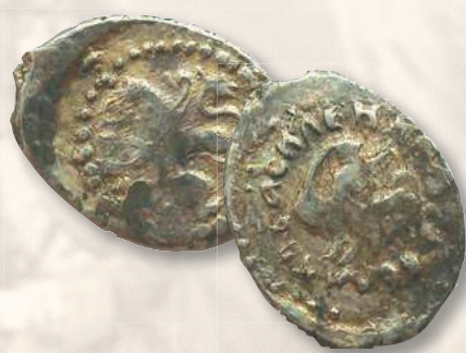
▲ Деньга князя Василия II Темного «копейник». Диаметр (длина) — 15,0—18,0 мм; вес — 0,4—0,8 г; металл — серебро.