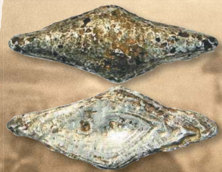
▲ Гривна черниговская.