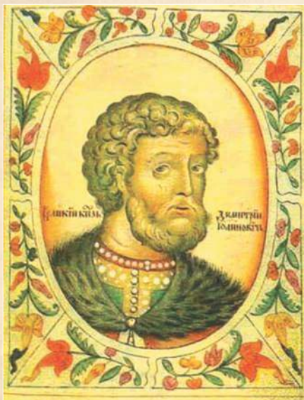
▲ Великий князь Владимирский и Московский Дмитрий Иванович Донской.

Монгольское нашествие 1237—1240 гг. кардинально изменило политическую структуру русских земель и привело к упадку Киева (разрушен в декабре 1240 г.). Город перестал быть объектом притязаний князей и вскоре утратил свои последние столичные функции. В 1243 г. владимирский князь Ярослав Всеволодович (1191—1246) первым получил от монгольского хана ярлык на великое княжение, утвердил своего наместника в Киеве, а столицей Руси назвал город Владимир. В 1299 г. туда же перенес свою резиденцию киевский митрополит.