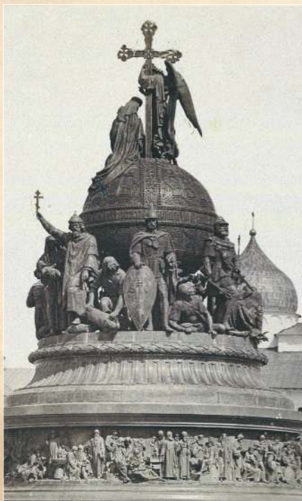
▲ Памятник в честь 1000-летия России, установленный в Великом Новгороде в 1862 г.