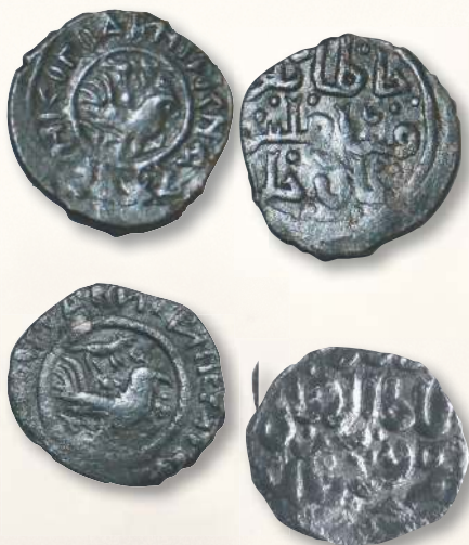
▲ Серебряные дирхамы в Донском княжестве Диаметр (длина) — 15,0–18,0 мм; вес — 0,95–0,98 г; металл — серебро.

воин, вооруженный мечом и секирой; четвероногое животное с загнутым вверх хвостом, поднятыми одной или обеими передними лапами и иногда с повернутой назад головой (предположительно это была владимирская эмблема — барс). Тем самым Москва демонстрировала свое положение преемника Великого Владимирского княжества. Между внутренним и внешним кольцами находилась круговая надпись с текстом: «КНЯЗЬ ВЕЛИКИ ВАСИЛИИ ВСЕЯ РУСИ» старорусскими буквами. На оборотной стороне находилась хорошо читаемая надпись на арабском: «СУЛТАН ТОКТАМЫШ ХАН. ДА ПРОДЛИТСЯ ЕГО ЦАРСТВИЕ». Ее исчезновение в годы правления Дмитрия Донского и появление вновь на монетах его сына специалисты связывают с тем, что независимая политика, проводимая Василием I, вызвала гнев ордынского хана. Главные претензии состояли в том, что московский князь обижал ханских послов, а сам ни сыновей, ни бояр в Орду не посылал, «выход» (дань серебром) хану не поставлял. В 1408 г. новый хан Золотой Орды Едигей, собрав большое войско, пошел с войной на Москву. Вторгнувшись в Московское княжество, он опустошил Серпухов, Верею, Дмитров, Городец, Клин, Нижний Новгород и Коломну. Москву спасло лишь то, что вследствие начавшейся смуты в Орде Едигей вернулся назад, разорив на обратном пути Рязань. После этого нашествия московский князь был вынужден несколько понизить политический статус своих денег. На лицевой стороне из титула Василия I исчезает фраза «вся Руси», а на оборотную возвращается арабская вязь.