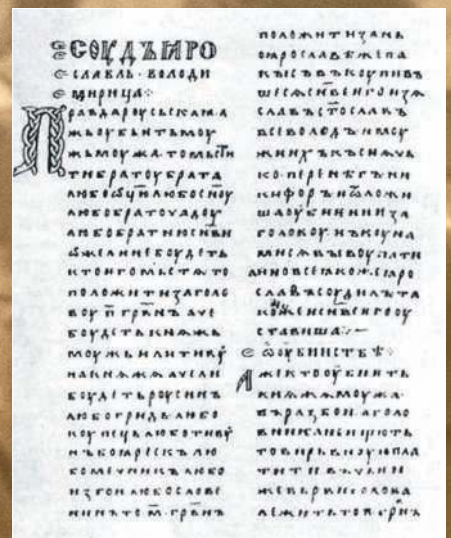
▲ «Русская Правда» — правовой кодекс Руси.