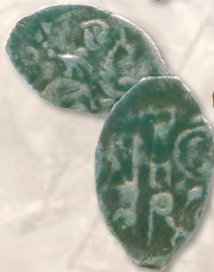
▲ Деньга князя Василия III Ивановича. Диаметр (длина) — 15,0—18,0 мм; вес — 0,73—0,76 г; металл — серебро.