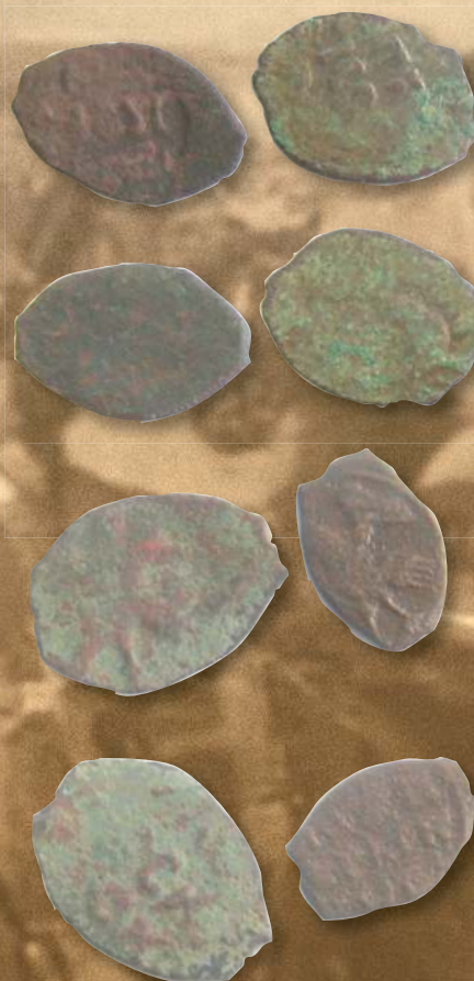
▲ Пуло тверское.