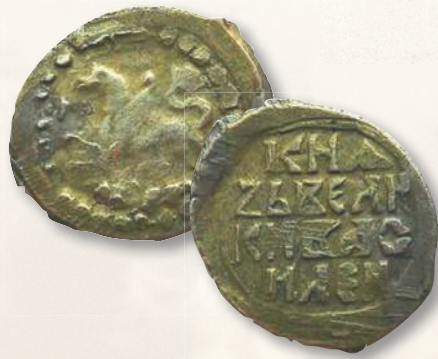
▲ Деньга князя Василия II Темного «барс». Диаметр (длина) — 15,0—18,0 мм; вес — 0,4—0,8 г; металл — серебро.