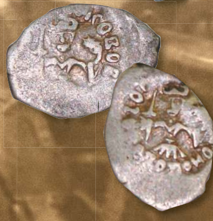
▲ Деньга князя Ивана III Васильевича. Диаметр (длина) — 15,0—18,0 мм; вес — 0,34—0,39 (0,73—0,0,76) г; металл — серебро.