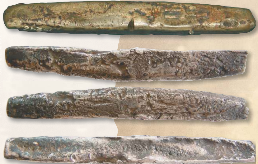
▲ Гривна новгородская.