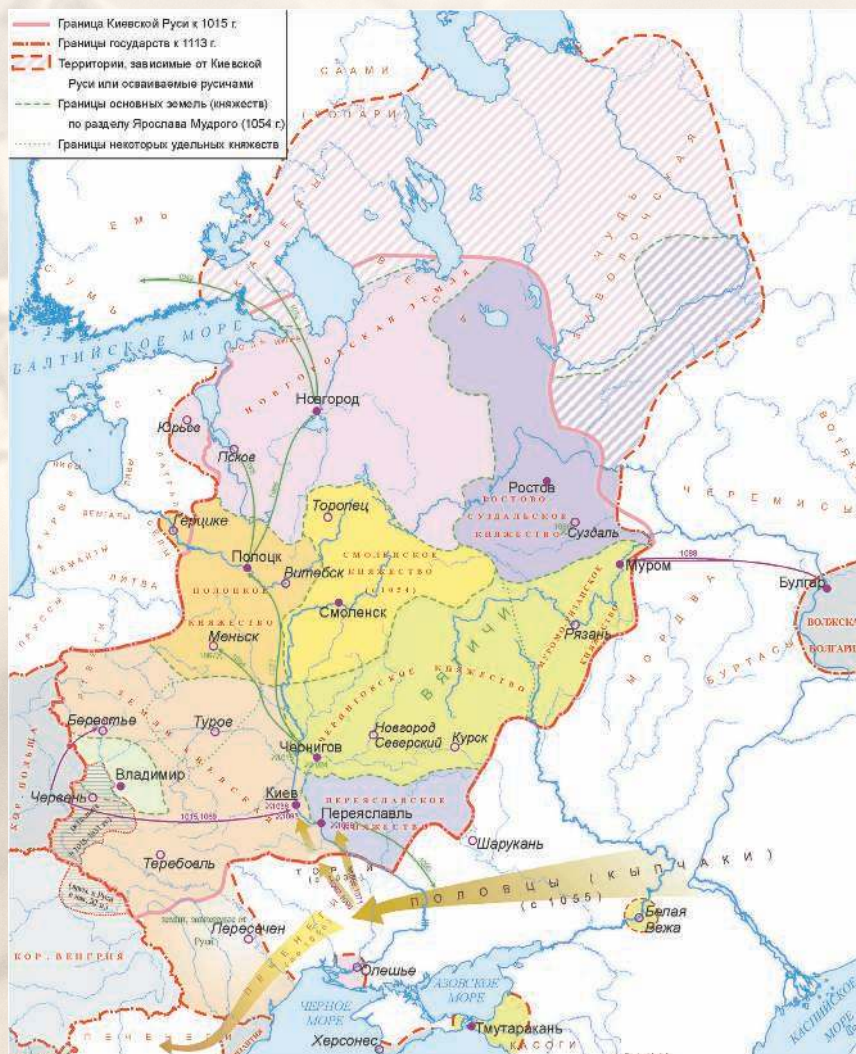
▼ Русь в XI в. (1015–1113).

В Киевской Руси с XI в. использовались киевские гривны — пластины серебра шестиугольной формы, размером примерно 70–80 мм на 30–40 мм, весом около 140–160 г, служившие единицей платежа и средством накопления. Однако наибольшее значение в денежном обращении имели новгородские гривны, известные сперва в северо-западных русских землях, а с середины XIII в. — на всей территории древнерусского государства. Это были серебряные палочки длиной около 150 мм и весом около 200–210 г. Переходной от киевской к новгородской была черниговская гривна, по форме близкая к киевской, а по весу — к новгородской.