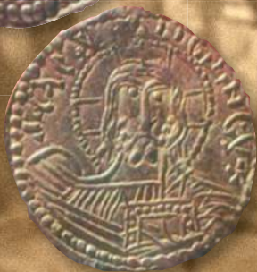
▲ Златник князя Владимира. Диаметр — 22,0—24,0 мм; вес — 4,0—4,4 г; металл — золото.