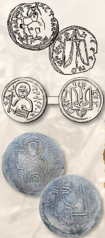
▲ Сребреник князя Владимира. Диаметр — 22,0–27,0 мм; вес — 2,6–3,2 г; металл — серебро.

Значения князя Владимира выпускались немногим более десяти лет — до конца X в., а сребреники — из XI в., как Владимирою, так и его кратковременным (с 1015 по 1019 г.) преемником на великокняжеском престоле старшим сыном святополком (Святославом).