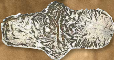
▲ Гривна киевская.