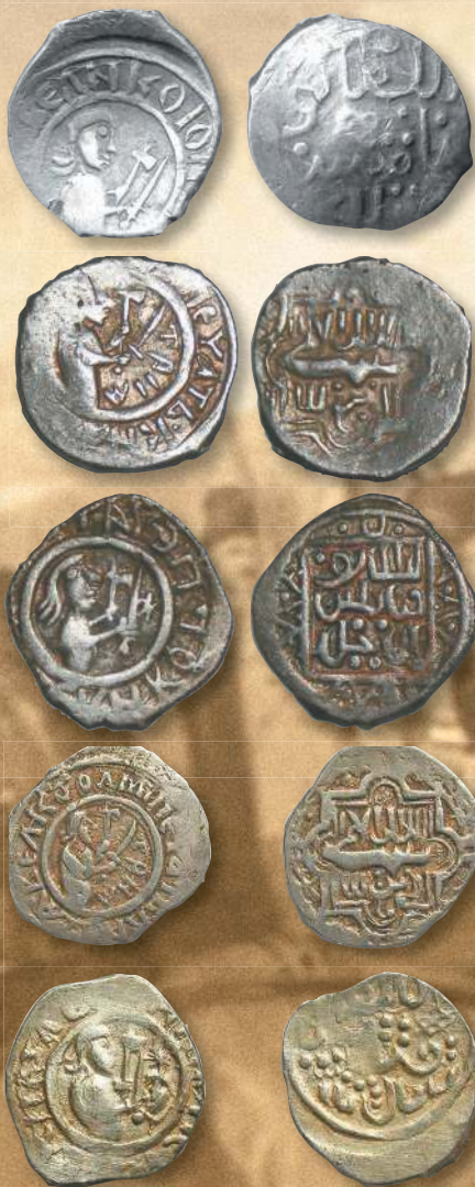
▲ Деньга князя Дмитрия Донского «воин». Диаметр (длина) — 15,0—18,0 мм; вес — 0,95—0,98 г; металл — серебро.

На лицевой стороне монет Василия I, в середине внутреннего кольца, могло находиться одно из следующих изображений: всадник с соколом на руке («сокольник»); всадник в развевающемся плаще; всадник в развевающемся плаще с копьём, поражающий дракона; всадник в развевающемся плаще с мечом; человек с саблями в обеих руках;