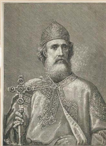
▲ Великий князь Киевский Владимир I Святославович.