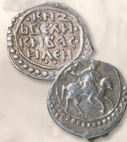
▲ Деньга князя Василия II Темного «сокольник». Диаметр (длина) — 15,0—18,0 мм; вес — 0,4—0,8 г; металл — серебро.