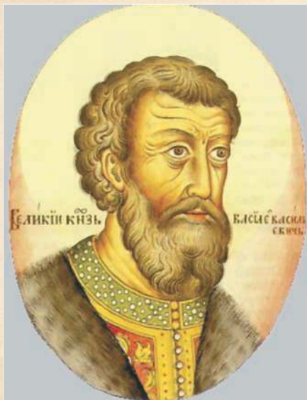
▲ Великий князь Московский Василий II Темный.