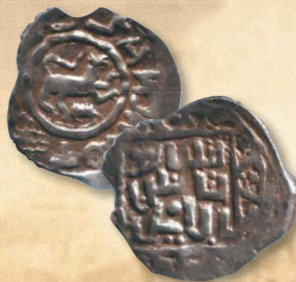
▲ Деньга князя Василия Дмитриевича «барс». Диаметр (длина) — 15,0–18,0 мм; вес — 0,7–0,9 г; металл — серебро.