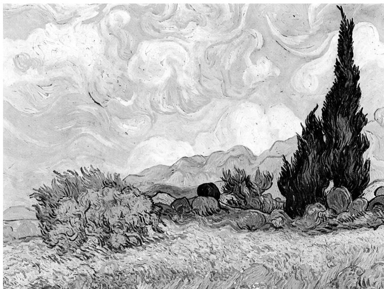
Винсент Ван Гог. Пшеничное поле с кипарисами (вариант). Сентябрь 1889. Лондонская Национальная галерея, Лондон

прочего будет подбирать цвета и сочетания, вырывающиеся из смирительной рубашки природы. Таким образом он утверждает свободу от нее. И потому то, что он делает, интересно».