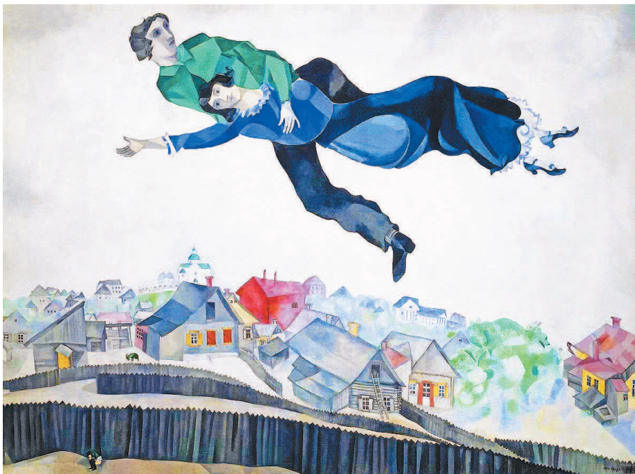
М. З. Шагал «Над городом», 1918 год, Государственная Третьяковская галерея

Это одна из величайших работ Марка Шагала, на которой он изобразил себя и свою музу Беллу, счастливо парящих над городом Витебском. Почему же они так счастливы? Дело в том, что им пришлось многое преодолеть, чтобы быть вместе.