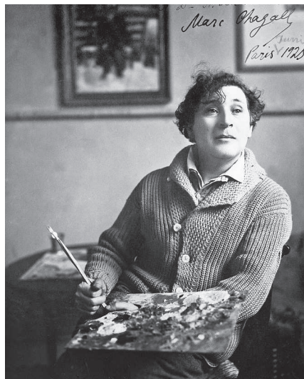
Марк Шагал, 1925 год