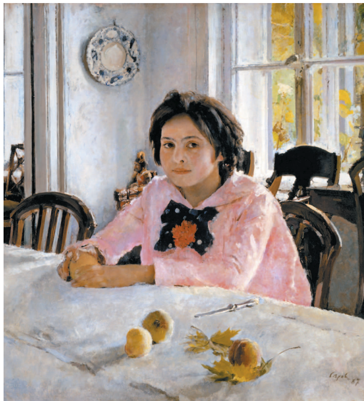
В. А. Серов «Девочка с персиками», 1887 год. Государственная Третьяковская галерея

На картине изображена дочка известнейшего предпринимателя, коллекционера и мецената — Саввы Мамонтова. Валентин Серов был другом семьи и часто гостил в усадьбе Абрамцево, где собирались знаменитые художники, музыканты, актеры, литераторы того времени.