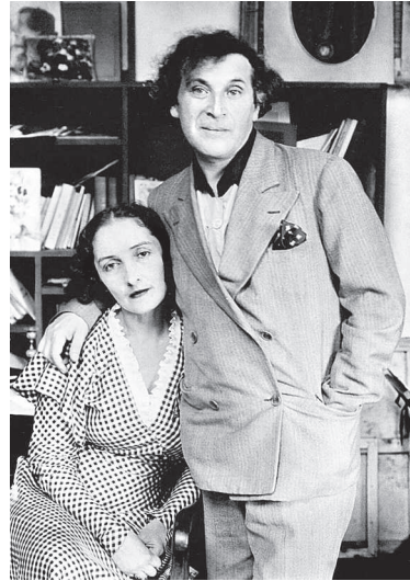
Марк и Белла Шагал