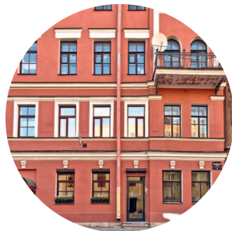
ДОХОДНЫЙ ДОМ НИКИТИНОЙ (1861 г., А. Ф. Занфтлебен) Манежный пер., 6 / Радищева пер., 2 с. 133