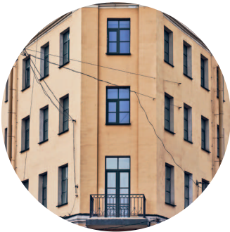
ДОХОДНЫЙ ДОМ (1875 г.) наб. Обводного канала, 128 / ул. Розенштейна, 1 с. 225