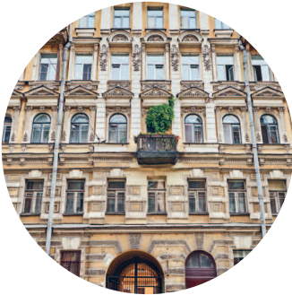
ДОХОДНЫЙ ДОМ (1882 г., архитектор А. И. Поликарпов) Верейская ул., 12