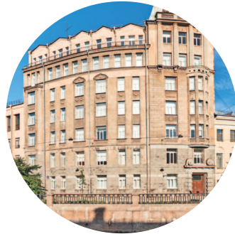
ДОМ БОГОМОЛЬЦЕВ (1913 г., архитектор О. Ф. Шульц) Грибоедова наб. к., 121