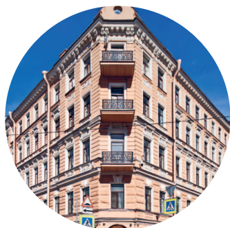
ДОХОДНЫЙ ДОМ СЕМЕНОВА