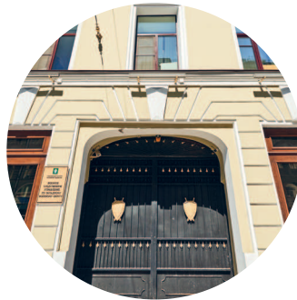
ДОМ ГЕРГЕНСА (1874 г., архитектор А. В. Шретер) Невский пр., 4 с. 229