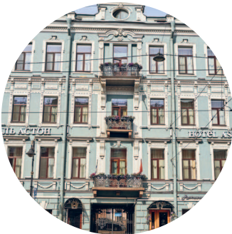
ДОМ МАЛОЗЁМОВА (1873 г., архитектор К. А. Кузьмин) Владимирский пр., 5