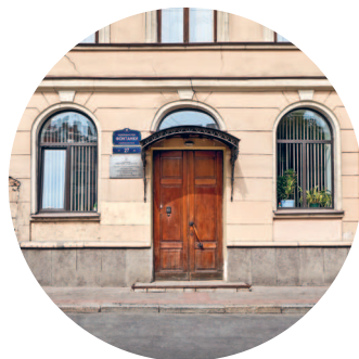
ДОМ ГУРЬЕВА (1820-е гг.) Фонтанки наб., 27 с. 109