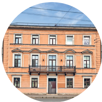
ОСОБНЯК ДИНГЕЛЬШТЕТА (1849 г., архитектор Б. Б. Гейденрейх) пр. Римского-Корсакова, 63 с. 97