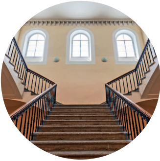
ЗДАНИЕ ДВЕНАДЦАТИ КОЛЛЕГИЙ (1742 г., архитектор Д. Трезини) Университетская наб., 7 с. 207