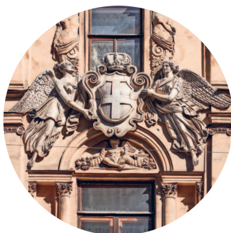
ОСОБНЯК ДЕМИДОВА (1840 г., архитектор О. Монферран) Большая Морская ул., 43