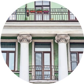
ДОМ КУКАНОВОЙ (1832 г., архитектор А. И. Мельников) Гороховая ул., 50 / Фонтанки наб., 79 с. 155