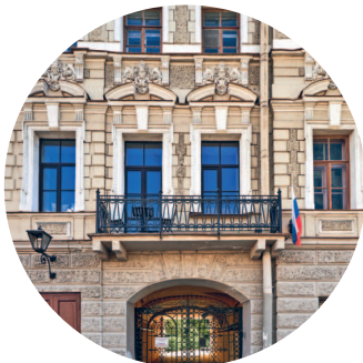
ДОХОДНЫЙ ДОМ (1875 г., архитектор И. А. Мерц) наб. р. Мойки, 10