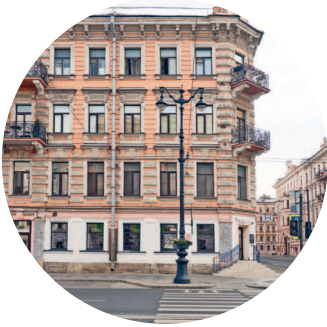
ДОХОДНЫЙ ДОМ КОКИНА (1874 г., архитектор И. И. Буланов) Невский пр. 158 / Перекупной пер., 2 с. 141