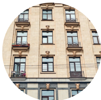
ДОМ РАБОТНИКОВ КИНОСТУДИИ «ЛЕНФИЛЬМ» (1939 г., архитектор Д. Г. Фомичев) Малая Посадская ул., 4а