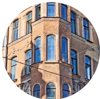
ДОХОДНЫЙ ДОМ (1910 г., архитектор М. И. Серов) Некрасова ул., 6 / Короленко ул., 1