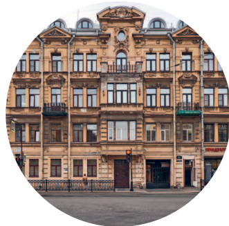
ДОХОДНЫЙ ДОМ ФЕДОРОВА (1879 г., архитектор В. Е. Стуккей) ул. Марата, 20