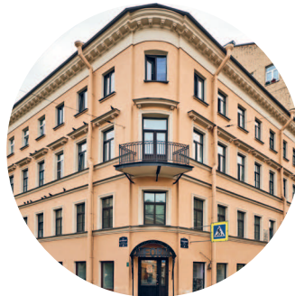
ДОХОДНЫЙ ДОМ О. ГОЛОВКИНОЙ (1840, архитектор К.-В. Винклер) ул. Достоевского, 28 / Разъезжая ул., 24