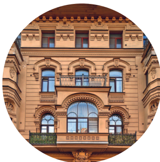
ДОХОДНЫЙ ДОМ ЗАЙЦЕВЫХ (1877 г., архитектор И. С. Богомолов) Фурштатская ул., 20