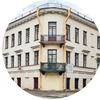
ДОМ ШАФФЕ (1885 г., архитектор В. А. Кенель) Большой пр. ВО, 17 / 5-я линия ВО, 16А с. 149