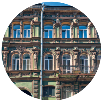
ДОХОДНЫЙ ДОМ КОНОВАЛОВОЙ (1874 г., архитектор В. М. Некора) Озерной пер., 12 с. 121