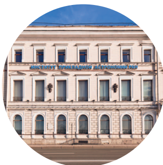
ОСОБНЯК ПАШКОВОЙ (1843 г., архитектор Г. А. Боссе) Кутузова наб., 10