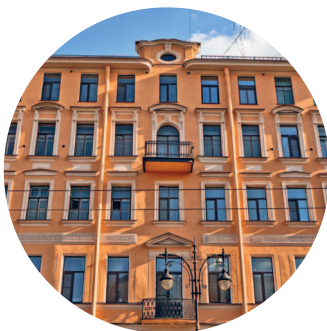
ДОМ ЩЕРБАТОВА (1909 г., архитектор И. И. Носалевич) Кирочная ул., 17