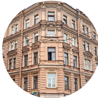
ДОХОДНЫЙ ДОМ (1881 г., архитектор А. А. Бертельс) наб. р. Фонтанки, 82 с. 159