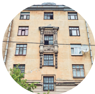
ДОХОДНЫЙ ДОМ СИДОРОВЫХ (1913 г., архитектор А. Б. Регельсон) Съезжинская ул., 22