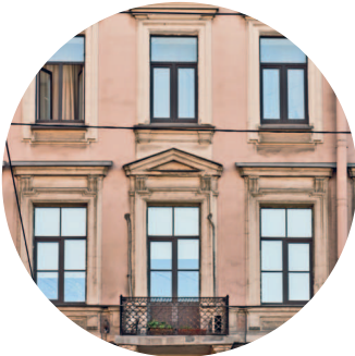
ДОХОДНЫЙ ДОМ (1860-е, архитектор Х. Х. Тацки) Литейный пр., 43