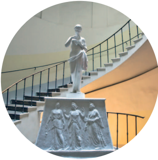
ЗДАНИЕ ОБЩЕСТВА ПООЩРЕНИЯ ХУДОЖЕСТВ (1893 г., архитектор И. С. Китнер) Большая Морская ул., 38