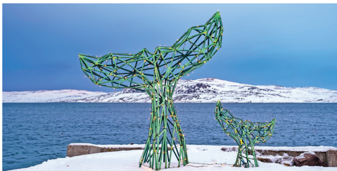
Памятник китам на Териберке

Вечер. Выберите для прощального ужина ресторан «Царская охота» (▷29) или более демократичный пивной ресторан «Пилигрим» (▷30).