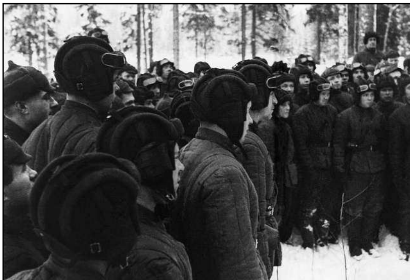
Митинг в танковой части перед боями. Карельский перешеек, декабрь 1939 года. На правом крыле танка Т-26 уложен брезент АСКМ).

СССР и Германия разделяли зоны своих интересов в Европе. Согласно этому протоколу Латвия, Литва, Эстония и Финляндия попадали в сферу интересов Советского Союза.