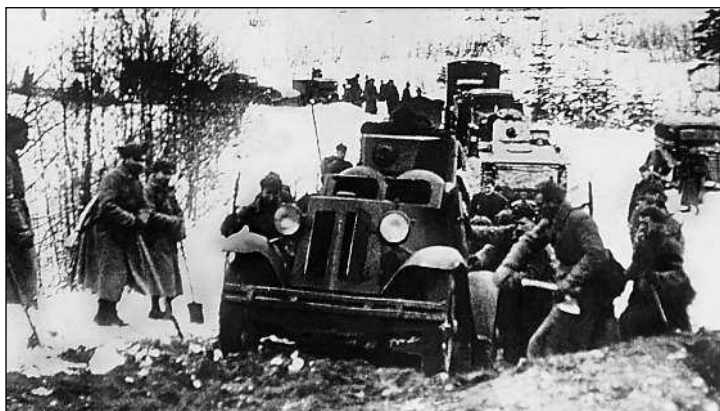
Бронеавтомобиль ФАИ 44-го отдельного разведывательного батальона 90-й стрелковой дивизии преодолевает подъем. Карельский перешеек, декабрь 1939 года.

Потребность СССР в Ханко обосновывалась наличием у Красной Армии аналогичной базы в Эстонии. Получив Ханко можно было бы огнем береговых орудий полностью перекрыть вход в Финский залив. Со стороны Карельского перешейка советское правительство стремилось обеспечить безопасность Ленинграда, отодвинув границу примерно на 80 км к северу (в то время