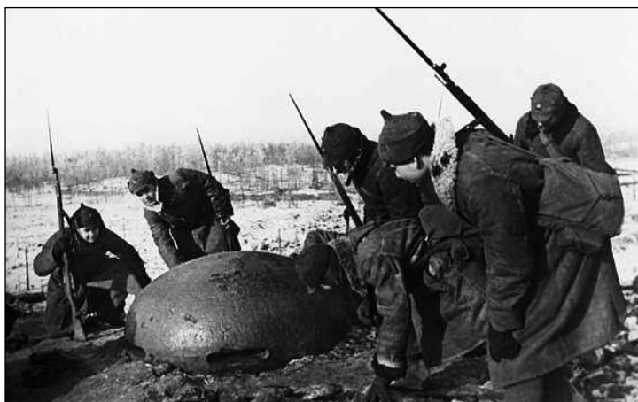
Красноармейцы осматривают наблюдательный бронекот из финских ДОТ. Карельский перешеек, февраль 1940 года.

СССР». В связи с этим предлагалось отвести финские войска от границы на 20–25 км, чтобы обеспечить безопасность Ленинграда. В ответной ноте финляндское правительство высказывало предположение, что инцидент у Майнилы возможно был следствием ошибки во время учебных стрельб с советской стороны и предлагало создать совместную комиссию по расследованию происшествия. Кроме того, в ноте предлагалось отвести от границы как финские, так и советские войска.