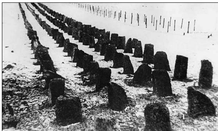
Препятствия «линии Маннергейма» – противотанковые гранитные надолбы в четыре ряда, за ними проволочные заграждения в три ряда.

Финская армия начала мобилизацию в октябре 1939 года и к началу войны имела десять пехот-