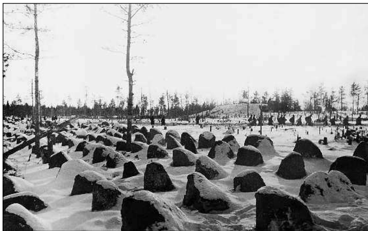
Гранитные надолбы в шесть рядов – типичные противотанковые препятствия «линии Маннергейма» (ЦМВС).

Союз денонсирует договор о ненападении, заключенный между СССР и Финляндией в 1932 году. На следующий день, 29 ноября, в ноте Молотова, направленной послу Финляндии, сообщалось о продолжающихся нападениях на советские пограничные части, в связи с чем правительство СССР не в состоянии «поддерживать нормальные отношения с Финляндией и вынуждено отозвать из Финляндии политических и хозяйственных представителей». Это означало окончательный разрыв между СССР и Финляндией. Даже сообщение финляндского правительства о согласии отвести войска от границы в одностороннем порядке, поступившее в Москву в тот же день, не могло повлиять на ход событий. Утром 30 ноября 1939 года заговорили советские орудия. Началась «Зимняя война».