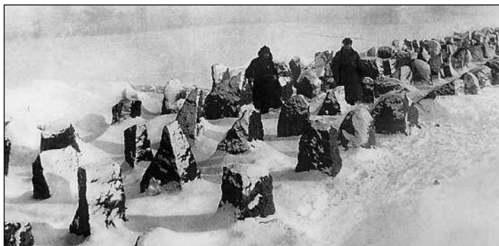
Красноармейцы на линии гранитных противотанковых надолб – размер последних можно оценить, сравнив их с фигурками людей.

В качестве руководящего органа была создана Ставка главнокомандующего под руководством маршала К. Маннергейма.