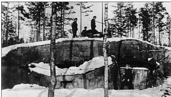
«Миллионный» ДОТ на «линии Маннергейма». Размеры сооружения можно представить, сравнив с фигурками стоящих рядом бойцов. Карельский перешеек, февраль 1940 года.

На переговорах в Москве 23–25 октября и 2–4 ноября 1939 года достичь компромис-