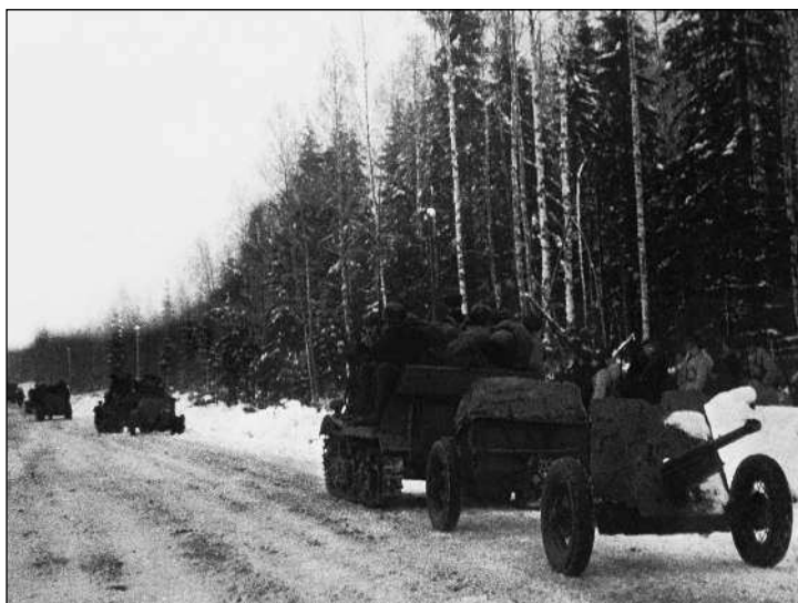
Бронированные тягачи Т-20 «Комсомолец» с 45-мм противотанковыми пушками выдвигаются к линии фронта. Карельский перешеек, район Васкелово, 2 декабря 1939 года.