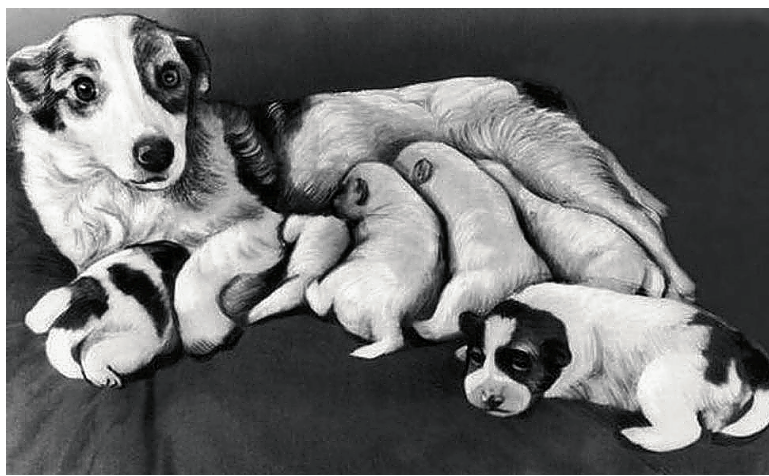
Космонавтка Стрелка и ее потомство

У Стрелки – шестеро щенков. Кормящую космонавтку тщательно обследуют медики – все параметры в норме, будто собака никуда и не летала. И прежде звезда, Стрелка теперь – самое медийное животное в мире. Одного щенка Хрущёв отправит семье президента США Джона Кеннеди. Подарок выглядит демонстрацией: вот кто лидер в советско-американской космической гонке. Материнское благополучие Стрелки доказало безвредность пребывания на околоземной орбите, и внутри СССР пропаганда явно подогревает ожидания, повторяя расхожую фразу: «Не за горами первый полет человека к звездам».