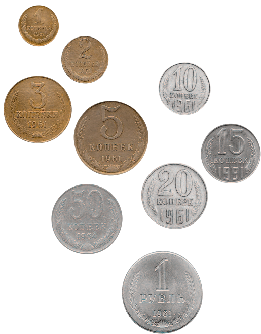
Монеты и купюры последнего советского образца – 1961 года

С 1 января 1961 года в СССР проводится денежная реформа. Это деноминация: рубли старого образца обмениваются на новые в соотношении десять к одному при пропорциональном пересчете цен