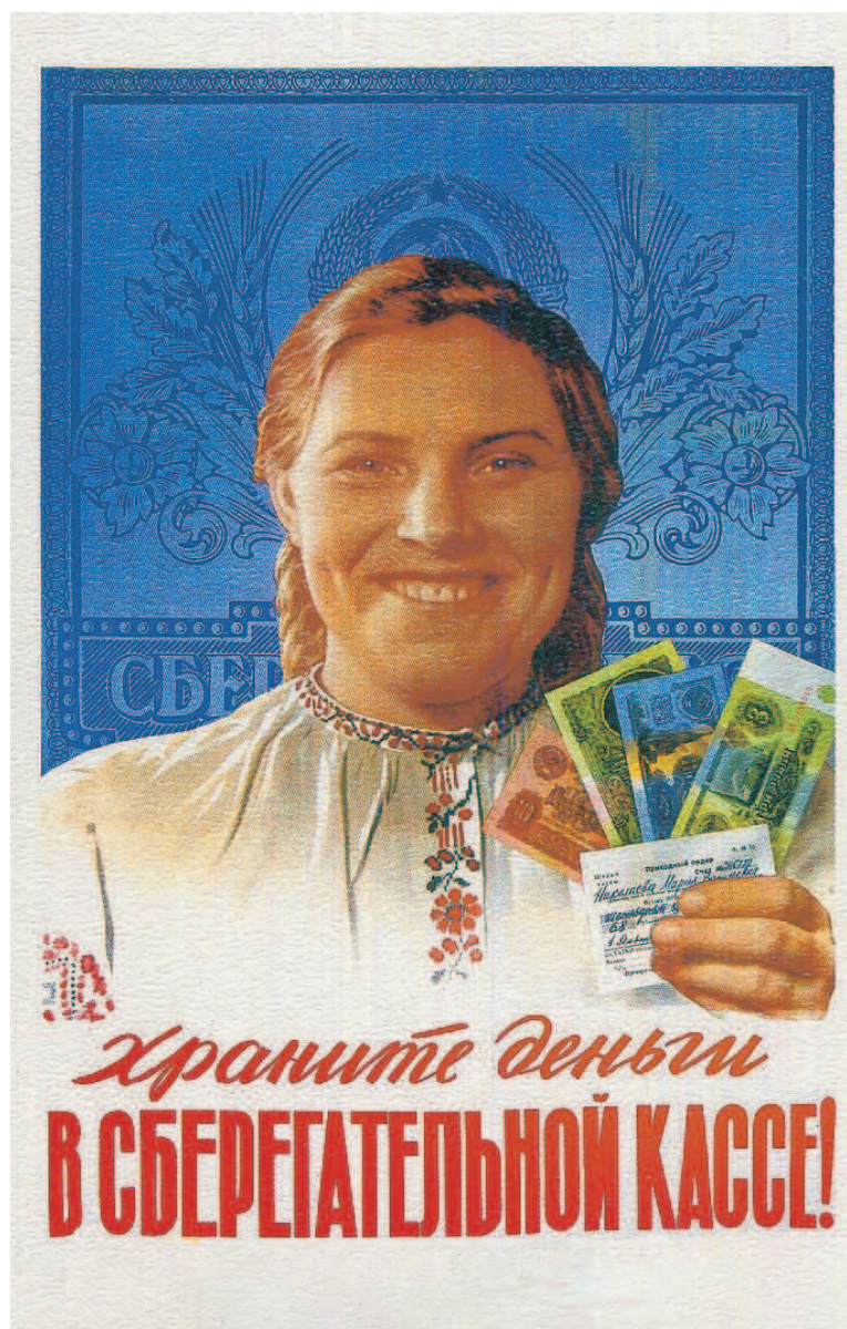
Плакат славит советскую зажиточность при новых деньгах

Пожилые люди к новым номиналам привыкают долго, в их обиходе фразы типа «пять рублей – это пятьдесят на старые деньги, дорого-то как!» продержатся до 1970-х. Поколения помоложе запомнят, «что почем было при советской власти», по масштабу цен, заданному в 1961-м, и передадут потомкам легенды о доступности тогдашней жизни. Фольклор сохранит выражения «я не дешежка по рубль двадцать», «зеленый как три рубля», «простой как две копейки» и проч. Когда герои «Иронии судьбы» (см. 1976) переплачивают за «польский гарнитур» 25 рублей, а Борис Гребенщиков (см. «Ленинградский рок-клуб», 1983) поет «Я инженер на сотню рублей» – это всё про «новые деньги», они же – последние в СССР.