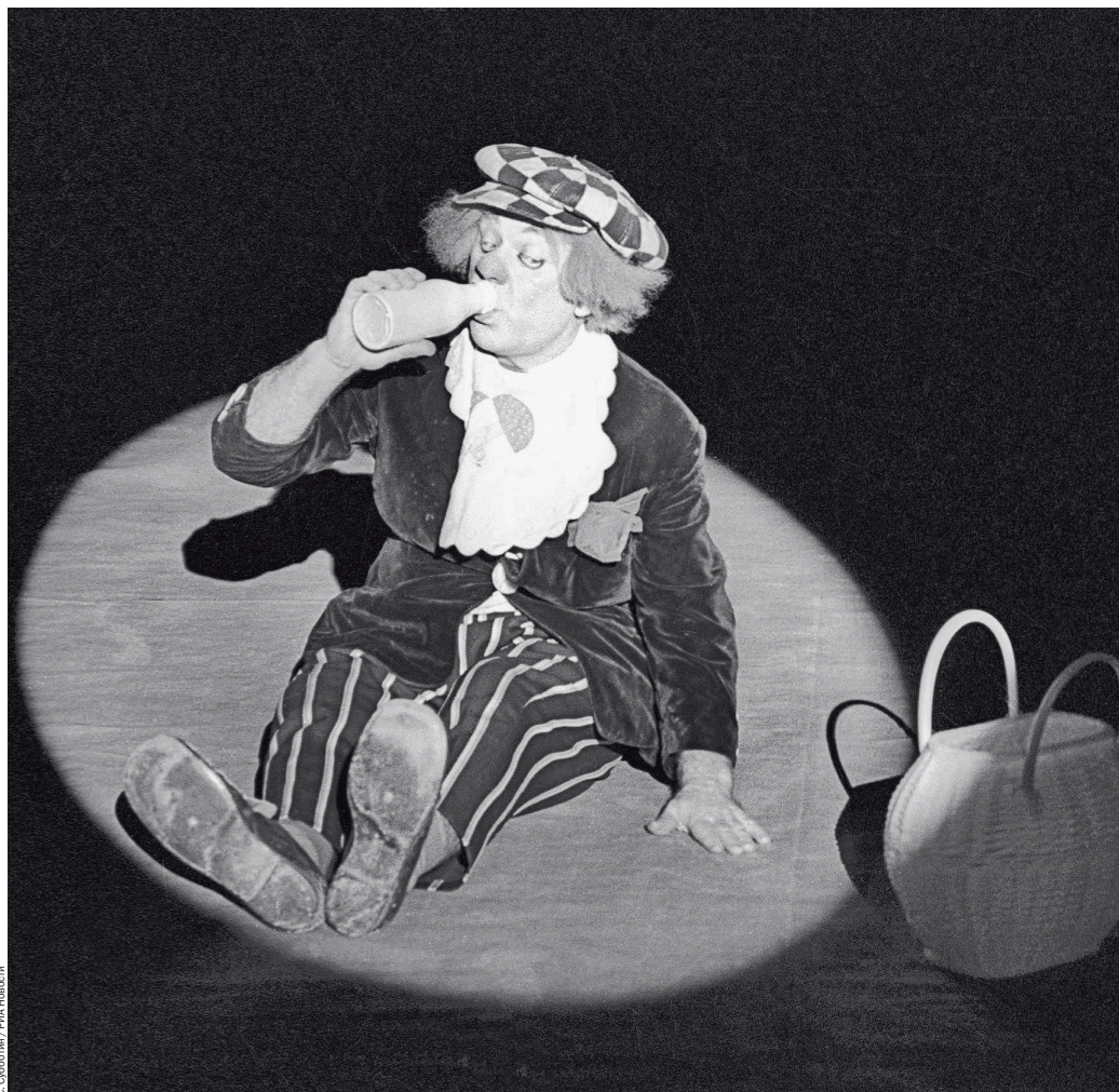
Миниатюра «Луч»: солнечный клоун в солнечном круге

Попов по первой своей цирковой профессии – эквилибрист, как клоун начал работать под руководством советского классика Карандаша (см. 1936). Теперь происходит смена поколений: имя «Олег Попов» быстро становится нарицательным, обозначая клоуна вообще. Публика не знает настоящего лица артиста, не слышала его голоса, но образ узнается мгновенно, и вскоре начнут выпуск первой советской именной куклы «Олег Попов».