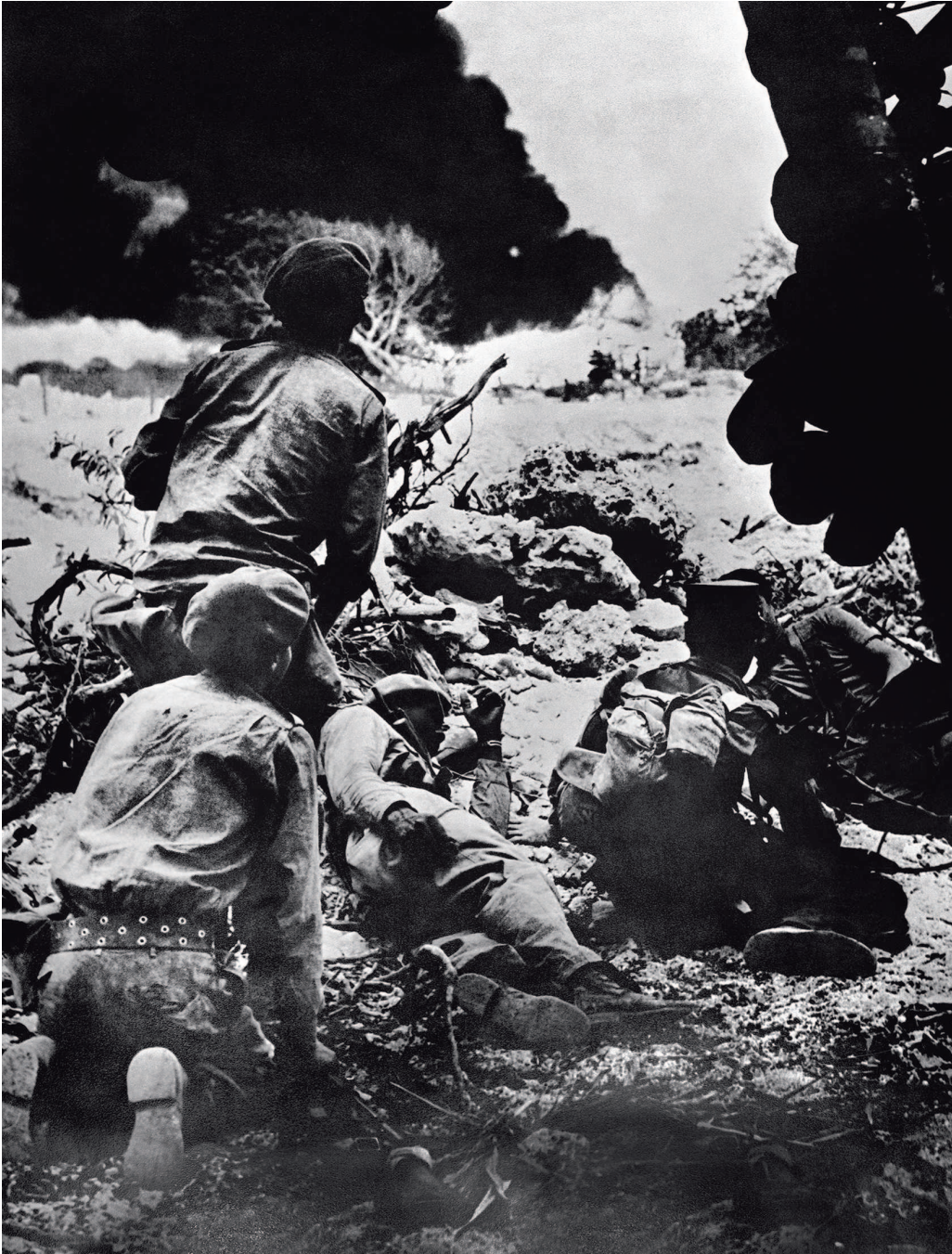
Кубинская армия ведет бой у залива Кочинос