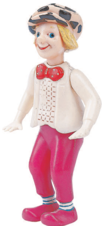
Олег Попов – именная кукла, первая в своем роде в СССР

Н омер оправдывает полученное Поповым на Западе прозвище «солнечный клоун». По арене бегают луч света из прожектора. Герой греется, сев в высвеченном лучом круге, устраивает там пикник, потом благодарно гладит поверхность