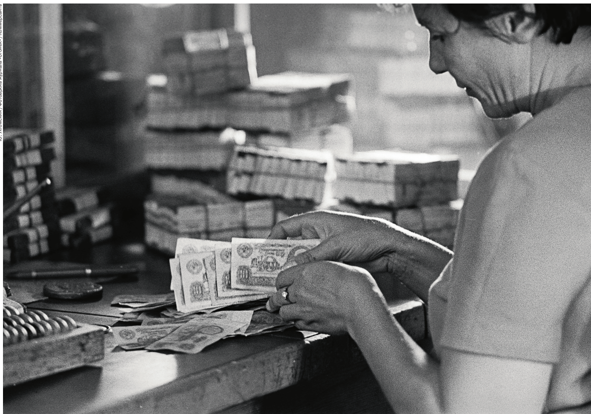
Обмен денег на новые в сберкассе

Н овые купюры по 1, 3, 5, 10, 25, 50 и 100 рублей проживут до конца социализма. На «банковских билетах» от 10 рублей и выше – барельеф Ленина в овальном медальоне, он же служит водяным знаком на полях. Портрет вождя помещали на банкноты и раньше, но именно про образцы 1961 года Андрей Вознесенский (см. 1964) напишет: