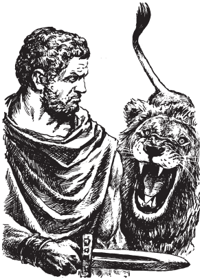
Император Каракалла (198–217 гг.)

чтобы не ходить далеко, если вдруг захочется сразиться с ними. Имелся среди них и любимец, которого правитель усаживал рядом с собой за стол и даже укладывал в кровать.