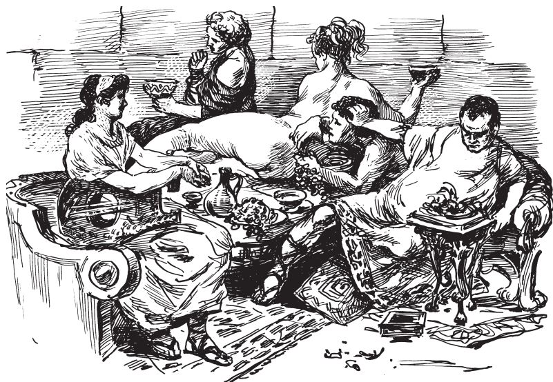
Император Элагабал (218–222 гг.) любил веселиться и устраивать розыгрыши

своей милости делать подарки: коней, колесницы, рабов... Часто после пиршества он приказывал своим гостям забирать с собой серебряную посуду, из которой они ели и пили.