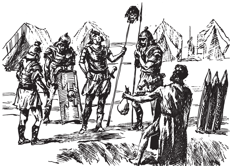
Дидий Юлиан перед гвардейцами

Очень богатый, но легкомысленный римлянин — некто Дидий Юлиан — узнал об этом предложении за трапезой. Видимо, Дидий был человеком не только легкомысленным, но и азартным, потому что, узнав, что конкурент за корону цезаря предлагает гвардейцам всего-то по пять тысяч драхм на каждого, он повысил ставку. Доторговался до шести, и гвардия объявила его императором!