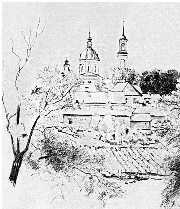
Овгуст — родовое имение Тютчевых. Вид из окна. Рисунок сделан с природы другом Тютчева поэтом Яковом Полонским.