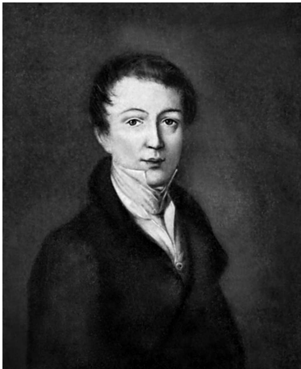
Ф. И. Тютчев. Портрет маслом работы неизвестного художника. Начало 1820-х годов.