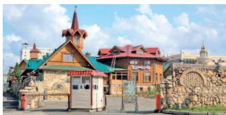
Татарская деревенька «Туган авылым» в центре города