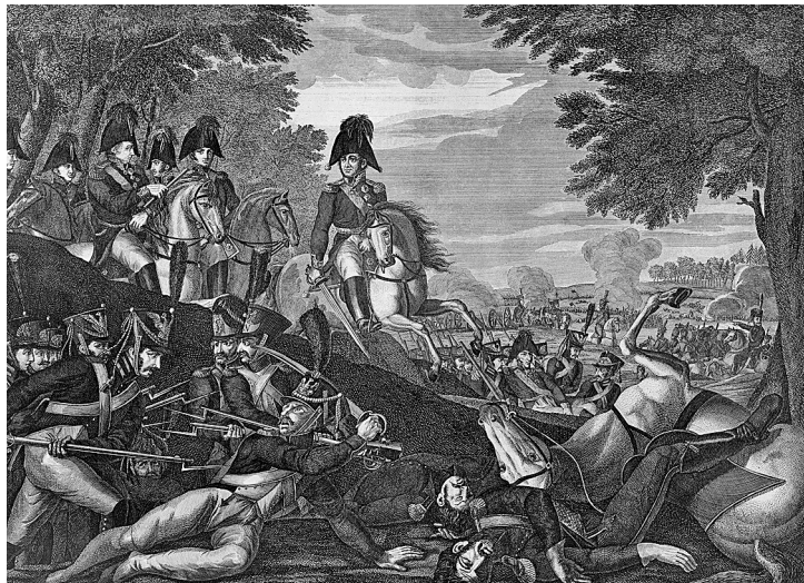
Сражение при Бородине, 26 августа 1812 г. Д. Скотти, 1883