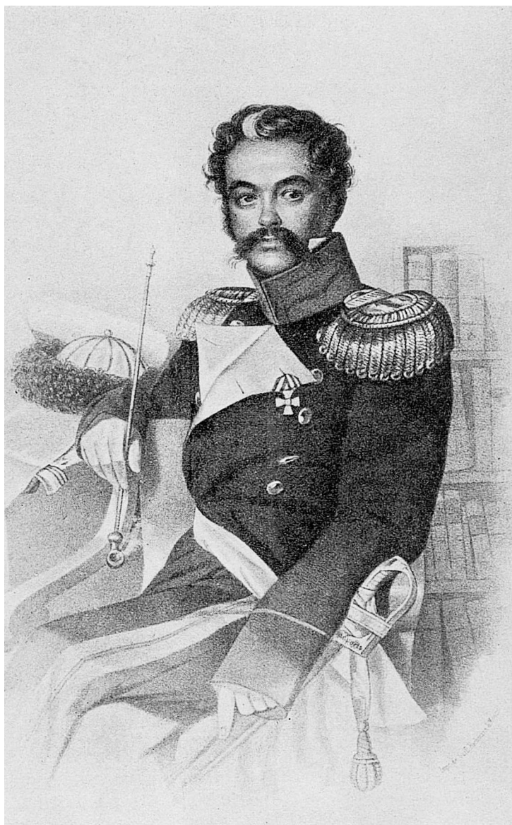
Д.В. Давыдов. Литография В. Бахмана