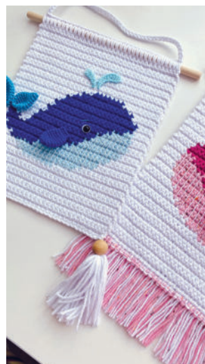
Панно «Кит» 127