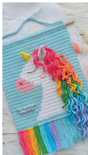
Панно «Единорог» 103