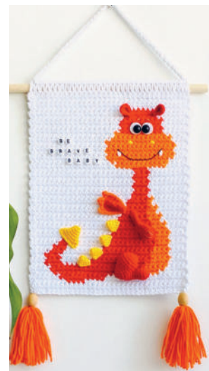
Дракончик, динозаврик 83