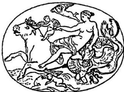
Амфитрита (с античной камен)

Глубоко в пучине моря стоит чудесный дворец великого брата громовержца Зевса, колебателя земли Посейдона. Властвует над морями Посейдон, и волны моря послушны малейшему движению его руки, вооруженной грозным трезубцем. Там, в глубине моря, живет с Посейдоном и его прекрасная супруга Амфитрита, дочь морского вешего старца Нерея, которую похитил великий властитель морской глубины Посейдон у ее отца. Он увидел однажды, как водила она хоровод со своими сестрами-нереидами на берегу острова Наксос. Пленился бог моря прекрасной Амфитритой и хотел увезти ее на своей колеснице. Но Амфитрита укрылась у титана Атласа, который держит на своих могучих плечах небесный свод. Долго не мог Посейдон найти прекрасную дочь Нерея. Наконец открыл ему ее убежище дельфин; за эту услугу