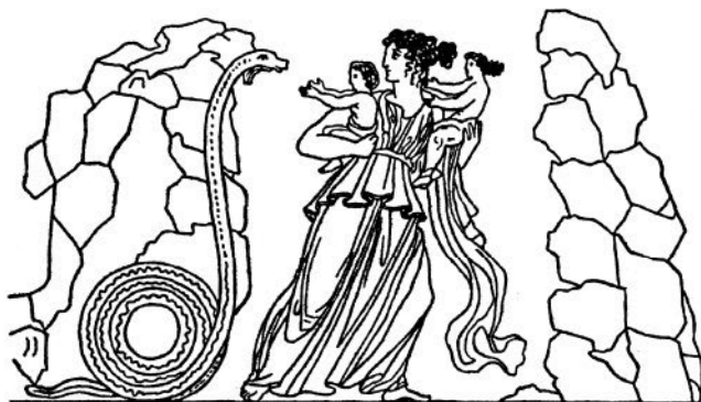
Пифон преследует Латону и ее детей, Аполлона и Артемиду (рисунок на вазе)

Борьба Аполлона с Пифоном и основание Дельфийского оракула. Юный, светозарный Аполлон понесся по лазурному небу с кифарой 1 в руках, с серебряным луком за плечами; золотые стрелы громко звенели в его колчане. Гордый, ликующий, несся Аполлон высоко над землей, грозя всему злему, всему порожденному мраком. Он стремился туда, где жил грозный Пифон, преследовавший его мать Латону; он хотел отомстить ему за все зло, которое тот ей причинил.