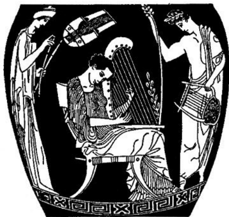
Музы и Аполлон (рисунок на вазе)

с девятью музами. Юные, прекрасные музы, дочери Зевса и Мнемосины 1 , — постоянные спутницы Аполлона. Он предводительствует хором муз и сопровождает их пение игрой на своей золотой кифаре. Величаво идет Аполлон впереди хора муз, увенчанный лавровым венком, за ним следуют все девять муз: Каллиопа — муза эпической поэзии, Эвтерпа — муза лирики, Эрато — муза любовных песен, Мельпомена — муза трагедии, Талия — муза комедии, Терпсихора — муза танцев, Клио — муза истории, Урания — муза астрономии и Полигимния — муза священных гимнов. Торжественно гремит их хор, и вся природа, как зачарованная, внимает их божественному пению.