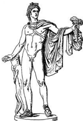
Аполлон Бельведерский (с античной статуи)

токудрого Аполлона. Тогда раздался звон тетивы серебряного лука, как искра сверкнула в воздухе не знающая промаха золотая стрела, за ней другая, третья; стрелы дождем посыпались на Пифона, и он бездыханный упал на землю. Громко зазвучала торжествующая победная песнь (пэан) златокудрого Аполлона, победителя Пифона, и вторили ей золотые струны кифары бога. Аполлон зарыл в землю тело Пифона там, где стоят священные Дельфы, и основал в Дельфах святилище и оракул, чтобы прорицать в нем людям волю отца своего, Зевса.