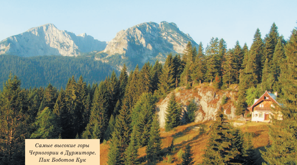
Самые высокие горы Черногории в Дурмиторе. Пик Воботов Кук