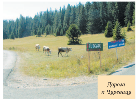
Дорога к Чуревацу

Фастфуд тоже на каждом шагу (гамбургер стоит 2,5€).