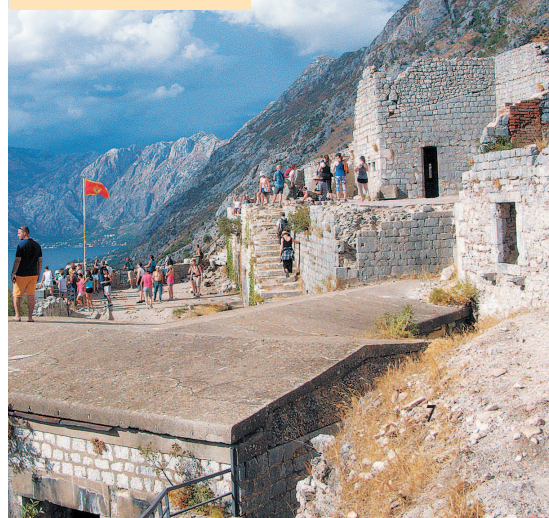
Крепость на горе Ловчен

Следует учитывать, что реальная картина будет несколько отличается от того, что выдаст сайт. Цены тоже могут колебаться в зависимости от перевозчика, времени года и еще бог весть каких причин. Потому всю информацию на эту тему следует принимать как ориентировочную.