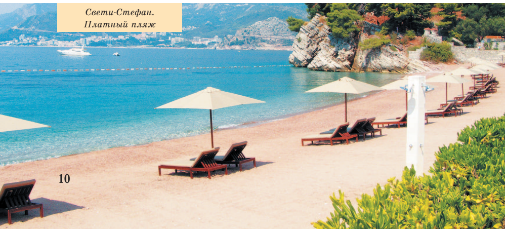
Свети-Стефан. Платный пляж

Которский залив потрясающе живописен. Ландшафты тут райские. Все, казалось бы, замечательно. Но крупных пляжей здесь нет. Кроме того, стоит обратить внимание на существенную деталь: залив, пусть даже и большой, – это частично замкнутая акватория и водообмен в нем не так интенсивен, как в открытом море. Процессы очищения идут медленнее, а берега усеяны населенными пунктами. Чтобы сделать вывод, не надо быть экологом. Но тем не менее у бокевских городков есть свои фанаты. Если вы творческая натура, любите средиземноморский колорит и неравнодушны к пейзажам, то отдых на берегах Боки для вас. А что касается воды, то на наших родных черноморских курортах ситуация куда более плачевная, так что все не так мрачно.