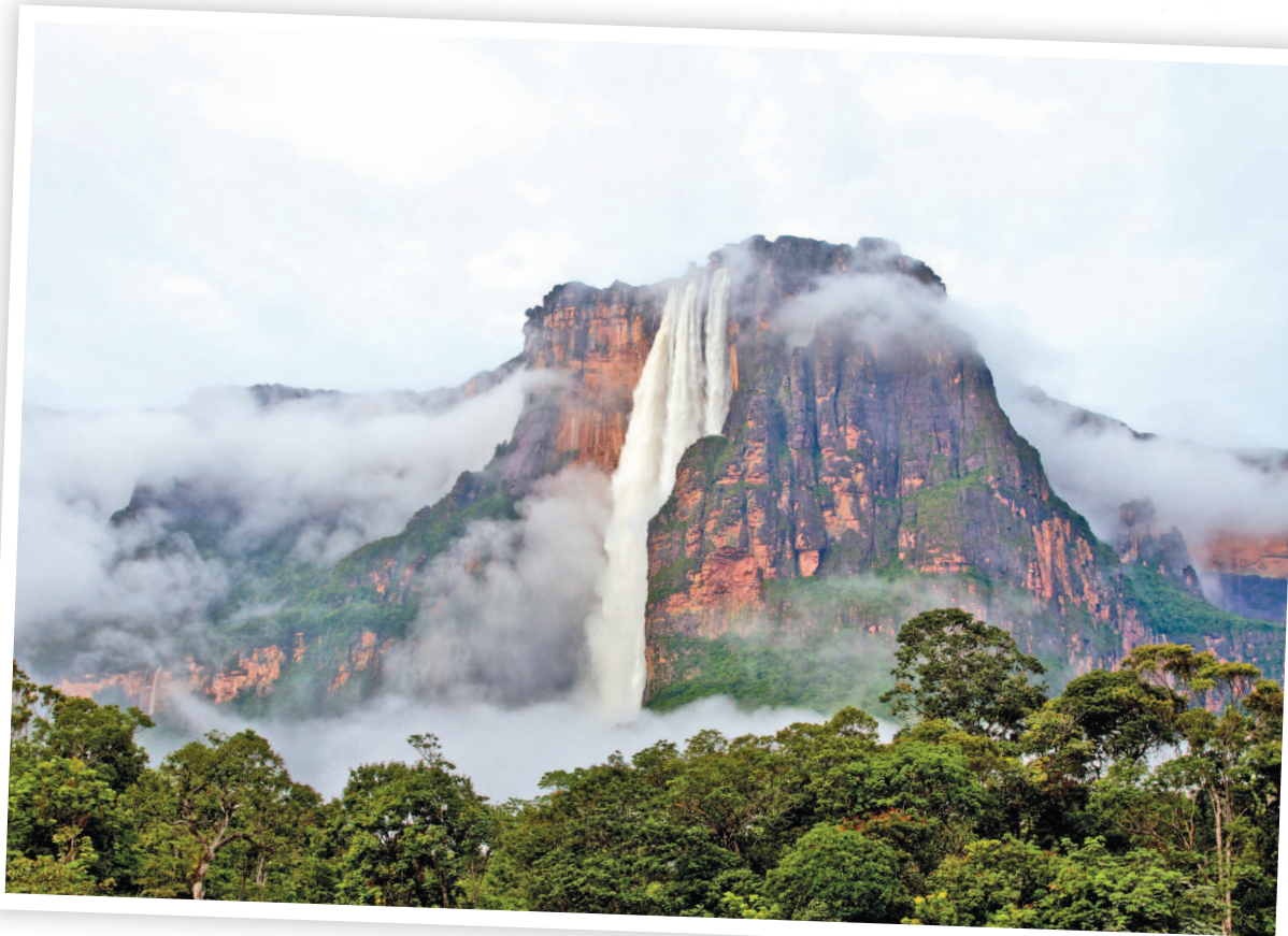
Высочайший водопад Анхель

Вскоре все четверо искателей приключений взирали на высочайший водопад планеты — Анхель, расположенный в Венесуэле.