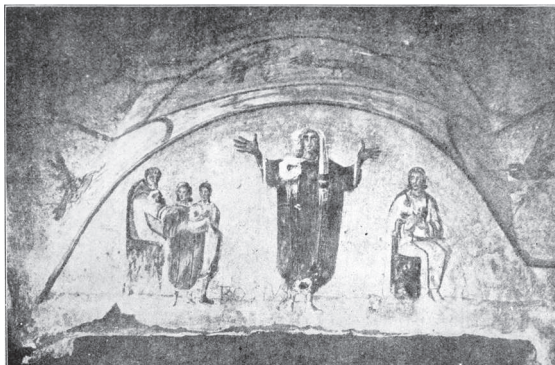
Оранта. Катакомбы Присциллы. Рим. III в. (из книги Ж С. 17)

В виде оранты или оранта — женщины или мужчины в молитвенной позе с воздетыми к небу руками — в раннехристианском искусстве изображалась душа усопшего человека.