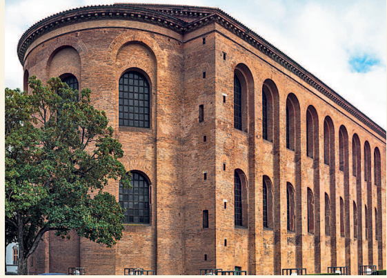
Базилика Константина. Трир, Германия. Ок. 310 г.

Существовал и другой, центрический тип храмов — круглый, многоугольный или крестообразный в плане (Мавзолей Галлы Плацидии в Равенне или Сан-Лоренцо-Маджоре в Милане (IV в.)).