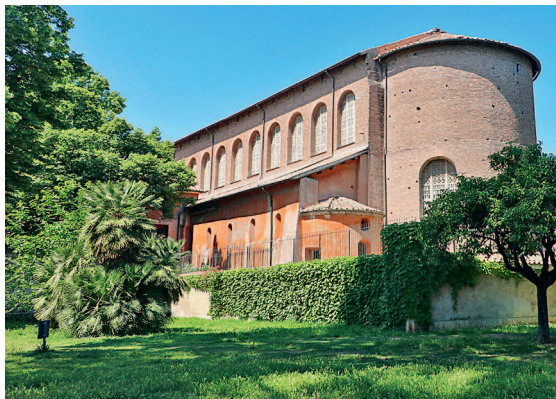
Базилика Санта-Сабина. Рим. 422–432 гг.

Архитектурный образ базилики мог совмещать в себе отдельные элементы как античного храма, так и общественных построек. В античной архитектуре храм традиционно представлял собой прямоугольный объем, по периметру которого с внешней стороны располагался ряд колонн. Все культовые действия совершались перед зданием или рядом с ним, и ритм внешних колонн мог задавать движение религиозных процессий. У христиан же, напротив, богослужение проводилось внутри храма, где часто собиралось большое количество людей. И теперь здесь, внутри, колонны, разделяющие нефы, задавали ритм движения верующих к алтарному пространству, к апсиде, где в момент таинства причастия из рук священника можно было вкусить хлеб и вино — символы тела и крови