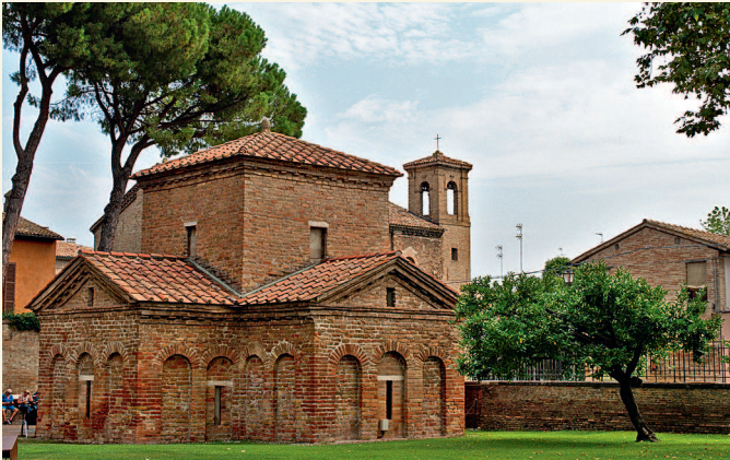
Мавзолей Галлы Плацидии. Равенна, Италия. V в.

Крестообразный в плане мавзолей Галлы Плацидии — образец центрического сооружения. На месте пересечения ветвей креста — средокрестия — расположена невысокая башня, отмечающая центр здания. Во внутреннем пространстве в башню вписан купол, невидимый снаружи. Интерьер богато украшен мозаиками.