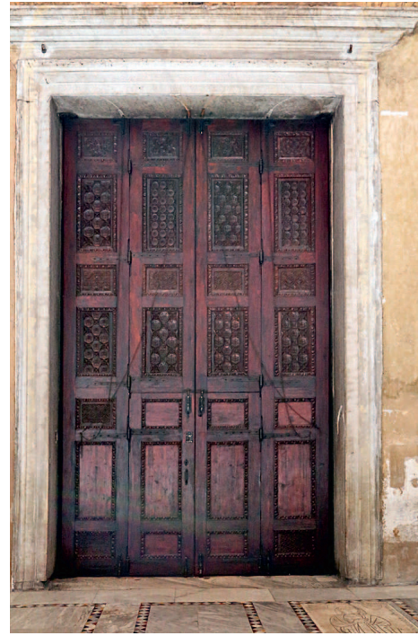
Двери базилики Санта-Сабина. Ок. 430–432 гг.

В этом храме находится и одно из самых знаменитых произведений раннехристианского искусства из числа сохранившихся — вырезанные из кипарисового дерева двери, расположенные на западной стене здания. Их датируют 430–432 годами.