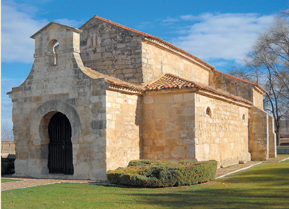
Церковь Сан-Хуан-де-Баньос. Паленсия, Испания. VII в.