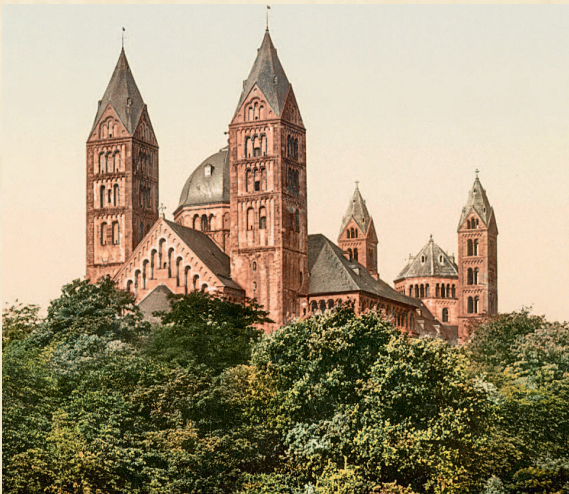
Собор в Шпайере. 1027–1100 гг.