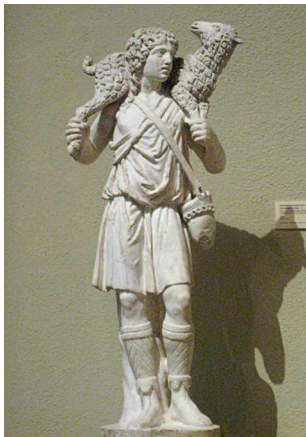
Добрый пастырь. III в.

В виде оранты или оранта — женщины или мужчины в молитвенной позе с воздетыми к небу руками — в раннехристианском искусстве изображалась душа усопшего человека.