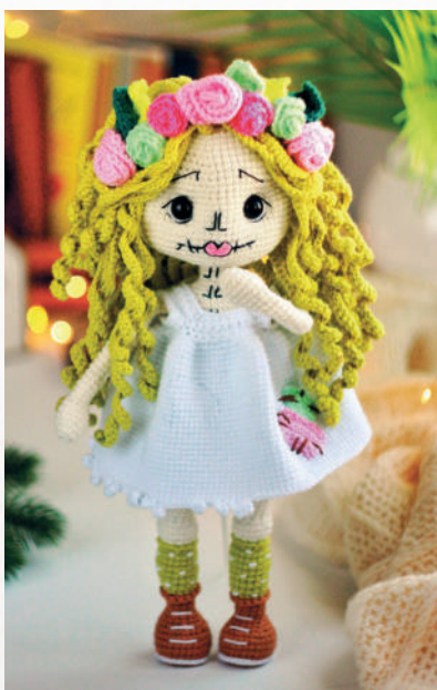
Санта Муэрте 108