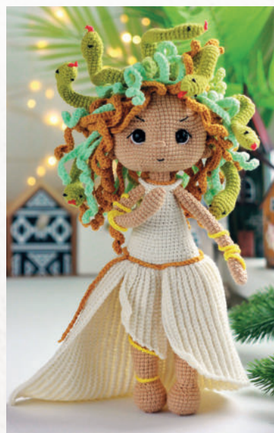
Горгона Медуза 126