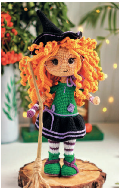
Ведьма Глinda 52