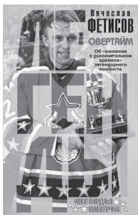
ВЯЧЕСЛАВ ФЕТИСОВ ОВЕРТАЙМ