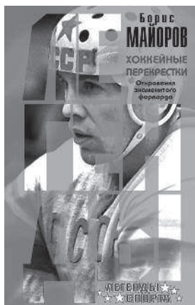
БОРИС МАЙОРОВ ХОККЕЙНЫЕ ПЕРЕКРЕСТКИ