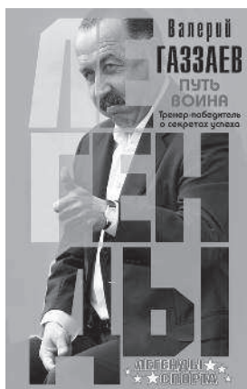
ВАЛЕРИЙ ГАЗЗАЕВ ПУТЬ ВОИНА