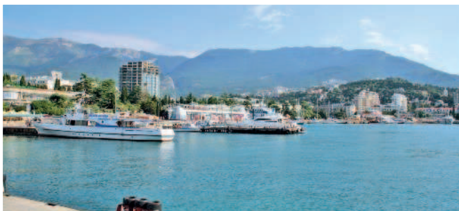
Вид на Ялту

В марте 2014 г. Крым после 23 лет пребывания в составе Украины вернулся в состав России благодаря проведенному там референдуму и сразу же занял ведущее место среди курортов нашей страны.