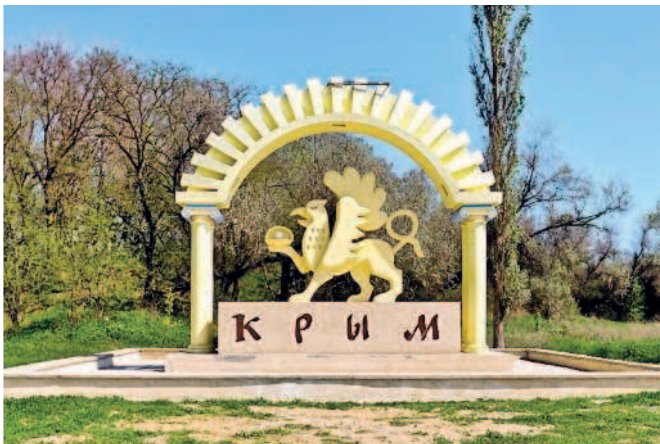
Въезд в Крым