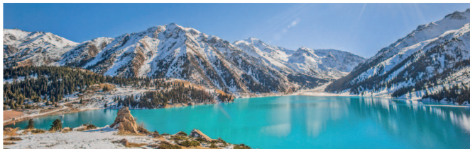
Большое Алматинское озеро