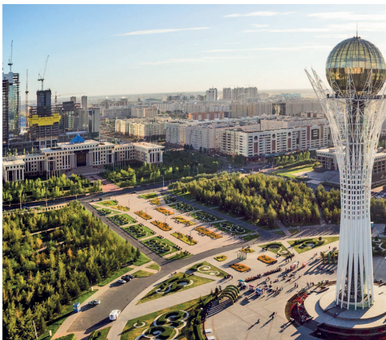
Столица Республики Казахстан — Нур-Султан

чтобы вдохнуть жизнь в Северный Казахстан. Футуристические здания Нур-Султана демонстрируют амбиции и желание Казахстана быть лидером среди государств Центральной Азии. Автором его генерального плана стал японский архитектор Кисе Курокава. А при разработке архитектурной концепции была взята