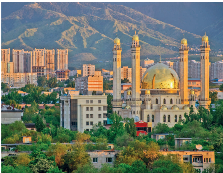
Вид на мечеть в Алматы

Вечер. Снимите накопленную за день усталость в новейшем аквапарке MIAMI Aquapark & SPA с разнообразными бассейнами, саунами, массажными и косметическими кабинетами (стр. 47). Поужинайте в кафе при аквапарке или отправляйтесь в ресторан «У Афанасьича» с хорошей кухней и вменяемыми ценами (стр. 45).