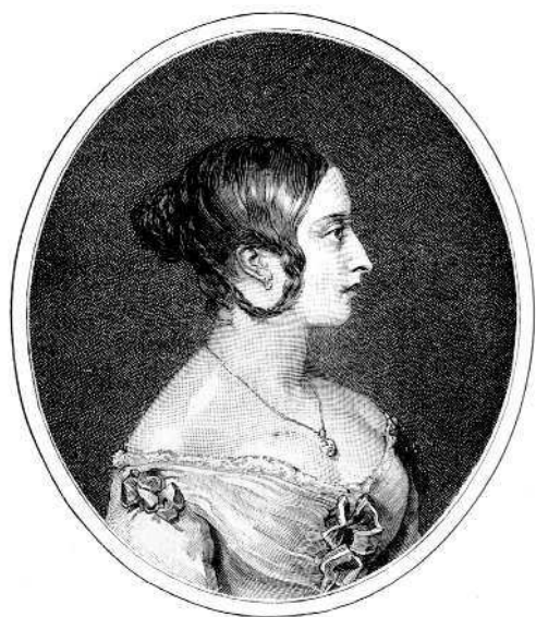
Королева Виктория и ее супруг Альберт