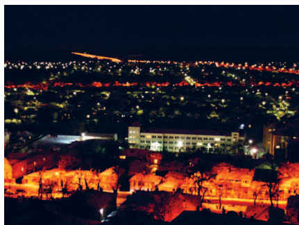
Вид на Пятигорск и Горячеводский от Китайской беседки

Машук. В ночное время телевизшка подсвечивается. Летом темнеет поздно, но в другое время можно подняться и спуститься на канатке в темноте.