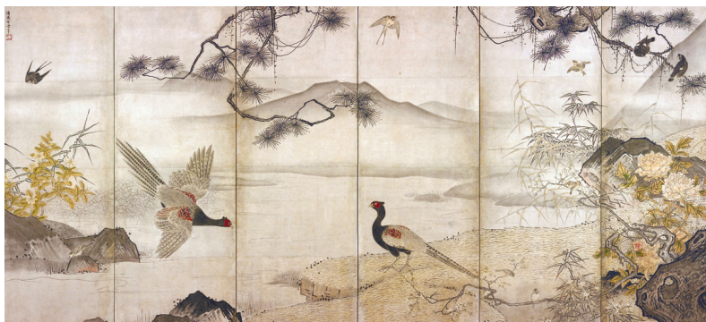
Сэсю. Цветы и птицы. XV в.