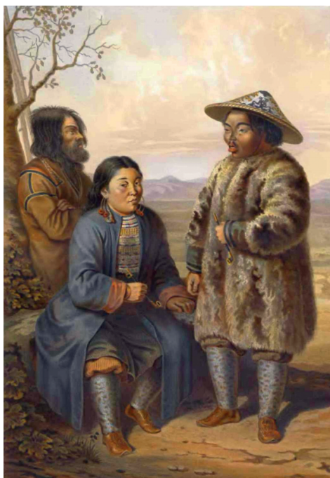
Айн и нивхи. Иллюстрация из «Этнографического описания народов России». 1862 г.