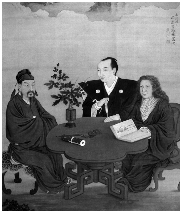
Сибата Кокан. Встреча Японии, Китая и Запада. XVIII в.

В первые века нашей эры на территорию Японии проникает буддизм , черты которого тоже отразились в мифологии и фольклоре. А еще появилось множество течений, объединивших в себе и синтоистские, и буддистские традиции!