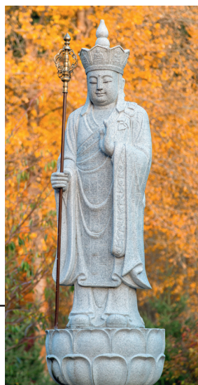
Старинное изваяние Кшитигарбхи, стоящего на лотосе. Современное фото