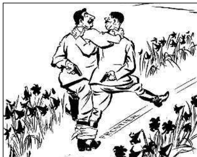
Советско-германский пакт Молотова-Риббентропа

взгляд наверняка «зацепит» по-настоящему смешная карикатура. И это не моё предположение, об этом свидетельствуют многочисленные исследования учёных-психологов.