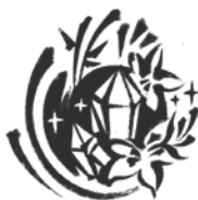
ГИЛЬДИЯ ЛУННОГО НЕФРИТА