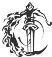
ГИЛЬДИЯ ОГНЕННОГО МЕЧА