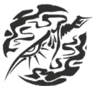
ГИЛЬДИЯ БЕЛОГО ДРАКОНА