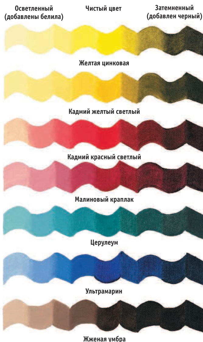
СВЕТЛЫЕ И ТЕМНЫЕ ТОНА. Здесь показаны изменения тона разных цветов. Чистый цвет в середине, слева — с добавлением белил, справа — с добавлением черного.

Цветовой круг — удачное подспорье при смешивании цветов. Все цвета, изображенные на нем, состоят из трех основных (желтого, красного и синего). Составные цвета (второго порядка) — фиолетовый, зеленый и оранжевый — получены от смешения двух основных. Существуют и цвета третьего порядка — это смесь основного и составного цветов (красно-оранжевый, желто-оранжевый, желто-зеленый, сине-зеленый, сине-фиолетовый и красно-фиолетовый). Дополнительные цвета — это два цвета, находящихся напротив друг друга на цветовом круге, а родственные цвета — это три смежных цвета на цветовом круге. Оттенок характеризует непосредственно цвет; насыщенность — яркость цвета, от чистого до приглушенного или разбавленного, а тон — степень светлоты или темноты цвета.