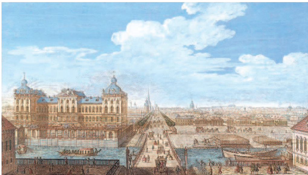
Рис. 1. Санкт-Петербург. XVIII в.

Третья задача — управление географическими объектами. К примеру, попытаемся ответить на вопросы: можно ли ограничить рост крупных городов, или он безграничен? Как вернуть население на опустевшие сельские территории? К сожалению, с целью воздействия на подобного рода процессы люди потратили большие усилия и средства, которые в большинстве своём не привели к положительному результату. Это было связано с тем, что не были учтены существующие внутренние закономерности происходящего социально-экономического развития. С некоторыми закономерностями вы познакомитесь в этом учебном году.