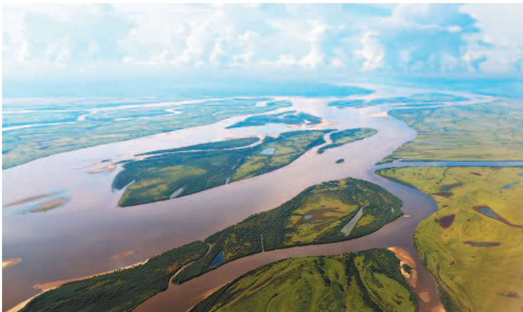
Рис. 2. Река Амур