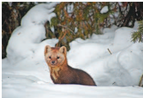
Рис. 4. Соболиные и бобровые меха «из Московии» составляли основу бюджета Российского государства

После преобразований Петра I в экспорте увеличилась доля различных товаров: железа, парусного и льняного полотна