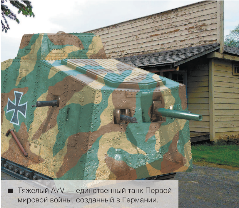
■ Тяжелый A7V — единственный танк Первой мировой войны, созданный в Германии.