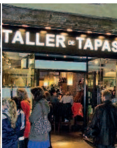
Taller de Tapas