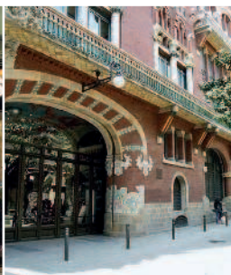
Дворец каталонской музыки