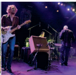
Luz de Gas