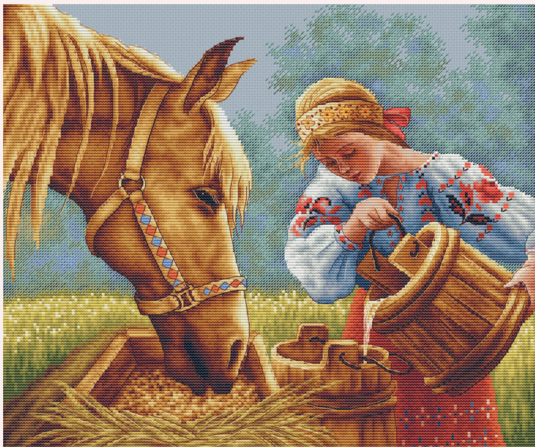
Ручная отрисовка, 49 цветов

О том, как создавать качественные, удобные и красивые схемы, я расскажу дальше. Будем разбираться шаг за шагом.