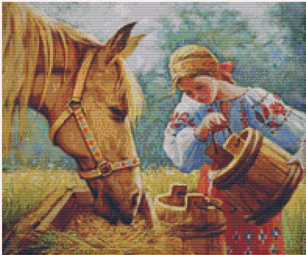
Прогон, 125 цветов

Самые качественные и удобные схемы получаются, если их отрисовывать вручную. Именно о таком способе отрисовки я расскажу в этой книге. При ручной отрисовке на картинку накладывается сетка и поверх нее «рисуют» схему, крестик за крестиком. Все цвета дизайнер подбирает вручную, переходы проверяют по живой карте цветов. Детали, требующие более точной проработки, прорисовывают бэкстичем.