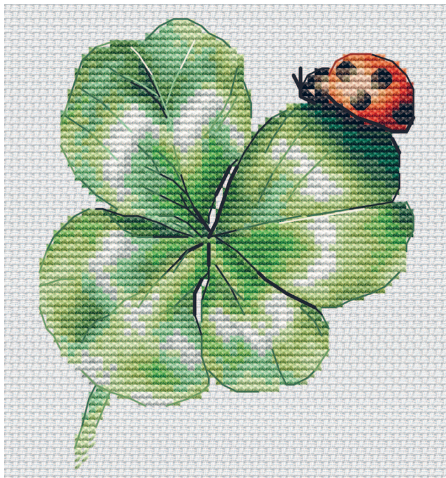
Проработанная схема, 21 цвет