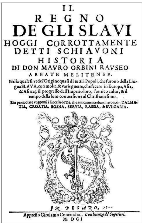
Титульный лист оригинала книги Орбини 1601 г.

2. «Поэт». Вообще говоря, упомянутые предания повествуют об античных мисте- риях.