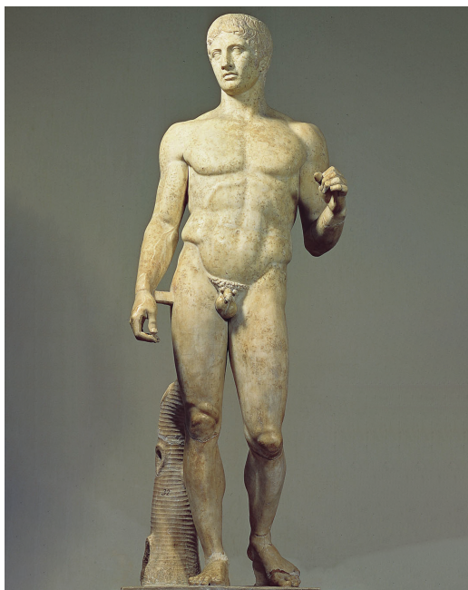
Рис. 0.2. Статуя копыеносца была первоначально создана Поликлетом в 450–400 гг. до н. э. Она являлась примером идеальных пропорций человека, на который ссылались многие, в том числе Гален, чрезвычайно влиятельный врач, живший 600 лет спустя, а также Витрувий и, наконец, да Винчи

Рисуя Витрувианского человека, да Винчи хотел продемонстрировать свое совершенное владение анатомией и понимание божественного начала, а также свою искусность в механике и архитектуре. Поместив человеческую форму внутри круга и квадрата, он тем самым демонстрировал соотношение божественного и земного в теле, а небольшое смещение круга вверх позволило пупку стать как геометрическим, так и физиологическим центром (см. также рис. 0.2). Однако он использовал инструменты того времени: угольник и компас. Тем самым Леонардо заложил первый камень недопонимания анатомии в современном мире, определив геометрическое совершенство анатомии, основанное на инструментах и методах строительства XV века.