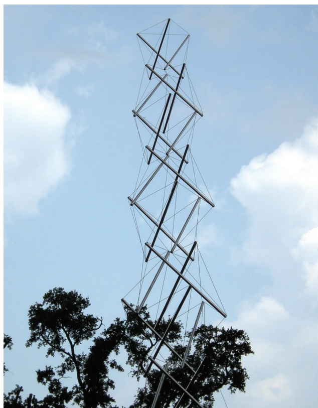
Рис. 0.4. Используя натянутые тросы и металлические распорки, можно создать самонесущие конструкции. Целостность этой конструкции определяется взаимодействием элементов сжатия и натяжения. Как отмечает Снельсон, если в простой структуре разрушение одного элемента может привести к разрушению всей структуры, в более сложных конструкциях подобный вызов в одной из ее областей приведет к менее катастрофическим последствиям (подробнее об этом — на его веб-сайте http://kennethnelson.net/faq ). Мы снова вернемся к этому, когда будем рассматривать тело и то, как оно может адаптироваться к дисфункции в какой-либо из его областей

Вплоть до XX века ученые придерживались преимущественно картезианского подхода к восприятию тела, концентрируясь на его частях и поддерживая образ тела, работающего по принципу архитектурной машины. Подобный взгляд не оспаривался вплоть до 1948 года, когда скульптор Кеннет Снельсон создал серию структур, неумышленно имитировавших взаимодействие между костями и миофасцией тела (см. рис. 0.4). Снельсон, обучавшийся у философа и архитектора Бакминстера Фуллера, использовал натянутые провода для обеспечения поддержки прочным компрессионным распоркам. Фуллер продолжил развивать эти идеи и геометрию того, что он впоследствии назвал структурами тенсегрити, используя их в качестве моделей для элементов естественного мира, начиная от атома до человечества и Вселенной в целом (интересный отголосок стремлений более ранних натурфилософов