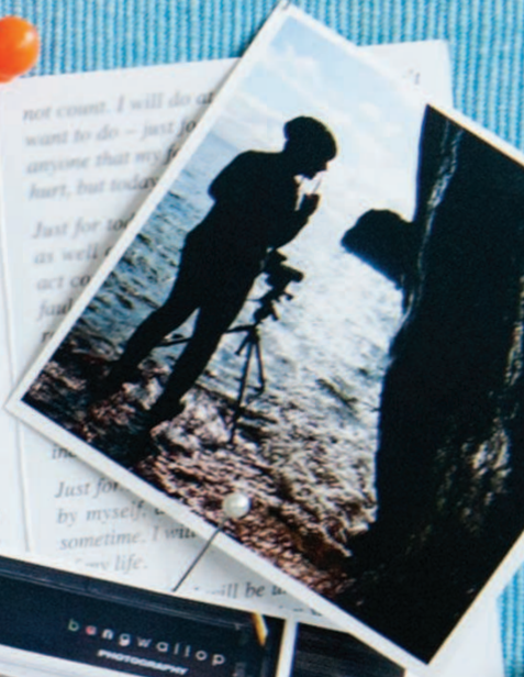
bang wallop: студия