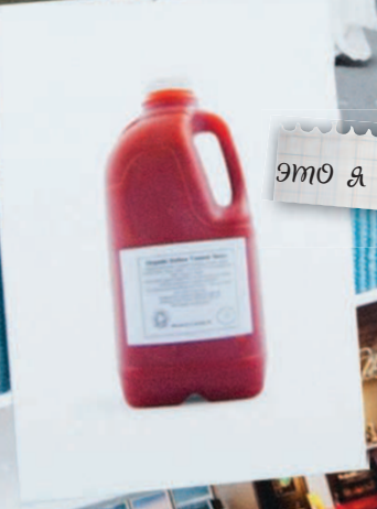
это я теперьшняя