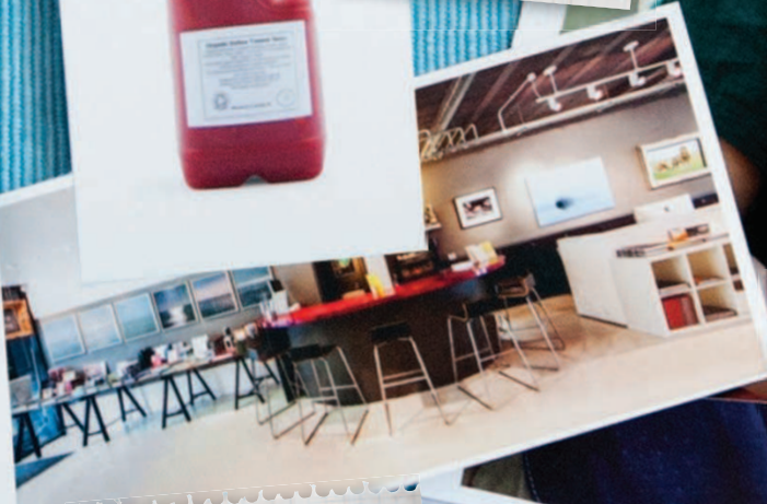
bang wallop: бар