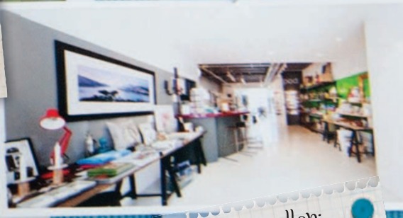
bang wallop: галерея