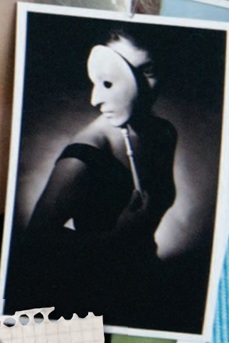
это я помоложе и мой первый нормальный фотоаппарат