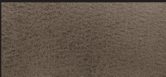
Средний тон в два слоя