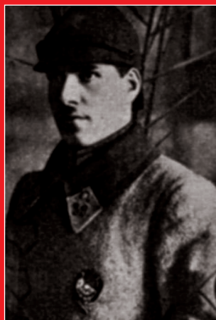
Г.К. Жуков. 1923 г.

Понимание проблемы в соответствующих ведомствах СССР присутствовало. Повышение читаемости записей советских полководцев было поручено литераторам. При этом «инженеры человеческих душ», которым была доверена литературная обработка, вносили свои помехи в создание мемуаров полководцев. Среднестатистический писатель обладал практически нулевыми познаниями в военном деле. Привычным для него было красивое описание подвигов отдельных личностей тактического звена в армейской газете «Ура вперед!». Термины и обороты, которые писатели могли нахватать на слух в штабе армии или фронта, только усугубляли общую картину поверхностных знаний, если даже не сказать невежества в военном деле. Поэтому замечательный писатель, без преувеличения классик советской литературы К. Симонов одновременно является автором целого ряда расхожих мифов о войне. Например, боевое применение бомбардировщиков «ТБ-3» в массовом сознании устойчиво ассоциируется с описанием их расстрела из «Живых и мертвых», хотя увиденное Симоновым отнюдь не является типичным случаем. Гиганты «ТБ-3» чаще