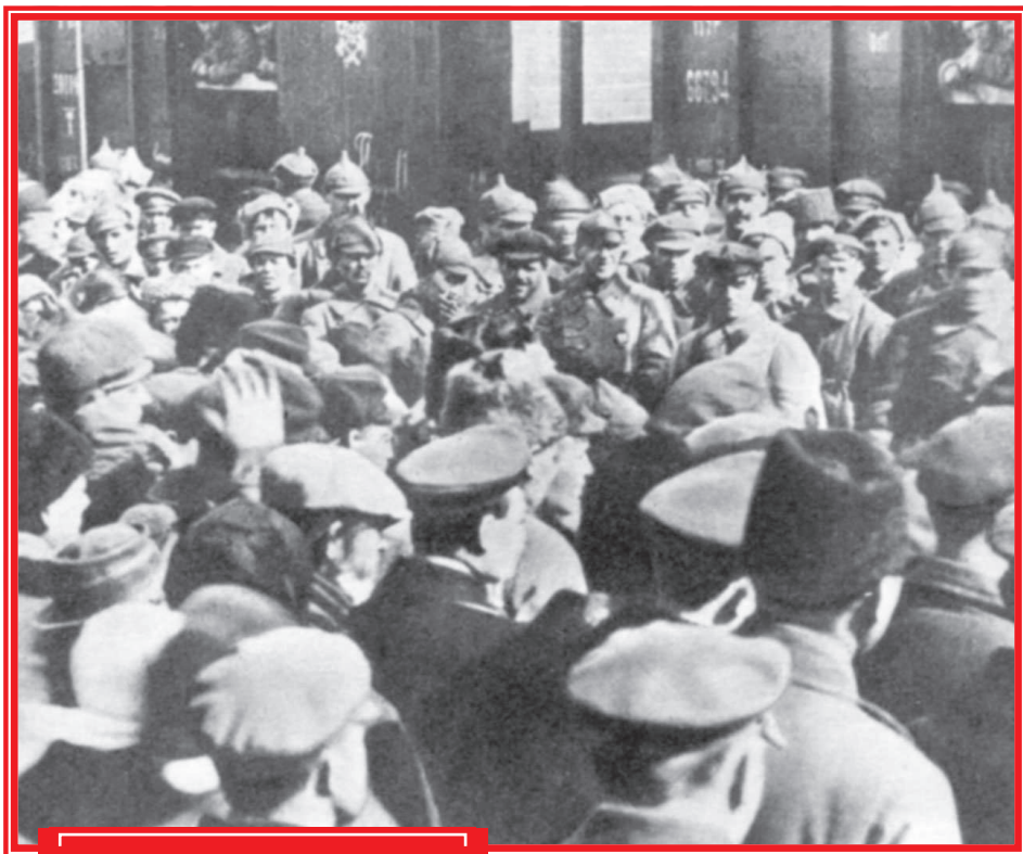
Новобранцы. В центре — командир полка Г.К. Жуков.