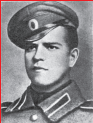
Вице-унтер-офицер Г. Жуков

мы увидим далее, при внимательном изучении событий августа — сентября 1941 г. выясняется, что глубокого предвидения не было и предложения Жукова носили локальный характер и никак не влияли на судьбу Юго-Западного фронта в целом.