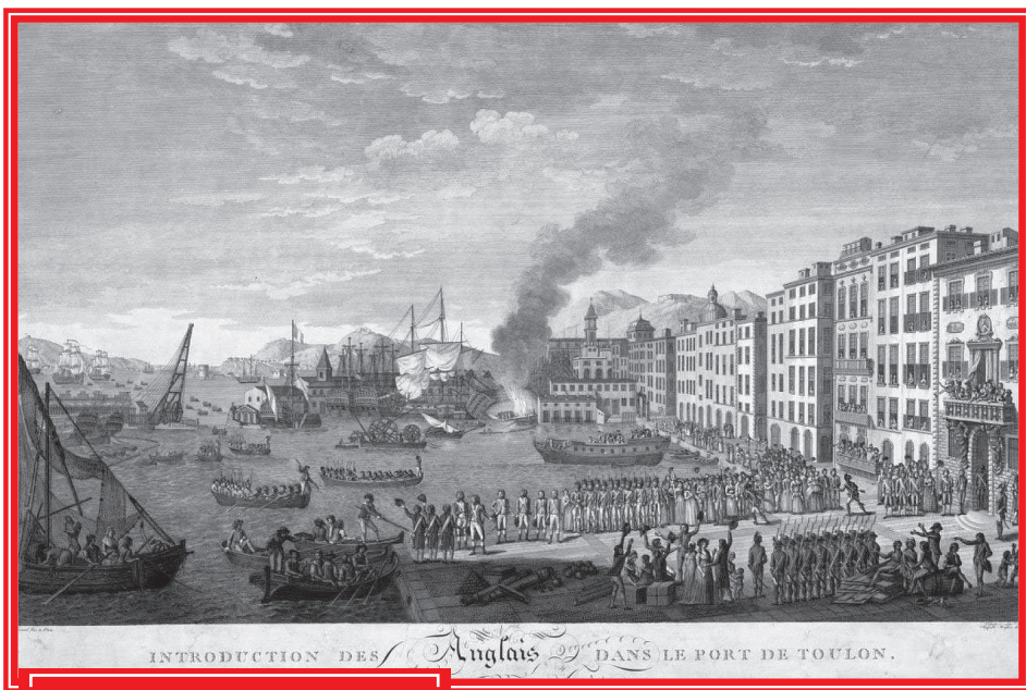
Англо-испанский флот в порту Тулона, 1793

на действительно уже было делом времени. Грамотные и решительные действия молодого капитана-артиллера были замечены в Париже. Началась карьера человека, прошедшего впоследствии шесть десятков сражений, количественно несравненно больше, чем в совокупности дали Александр Македонский, Ганнибал, Цезарь и Суворов.