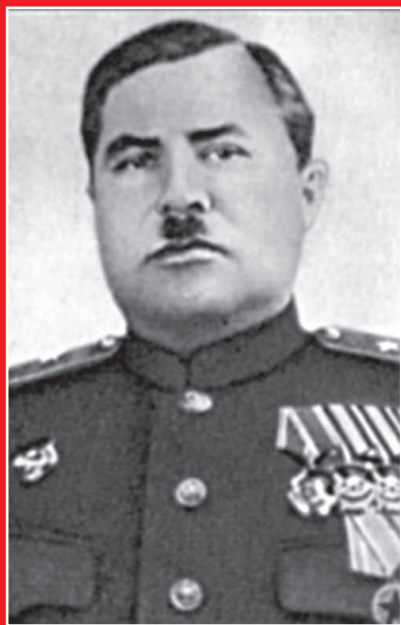
Командующий 57-м Особым корпусом Н.В. Фекленко, послевоенная фотография

и подчиненным, в последнем случае наблюдается излишняя жесткость и грубоватость». Видимо, считалось необходимым «встряхнуть» командиров в удаленном от столиц и затерянном в степях Монголии 57-м Особом корпусе. Также Буденный отметил, что у Жукова «чувство ответственности за порученную работу развито в высокой степени». Похоже, Семен Михайлович сумел разглядеть в молодом красном командире качества характера, которые были куда важнее знания специфики какого-либо театра военных действий — умение повелевать и твердость характера. Пока Жуков был отправлен в роли требовательного проверяющего, который не углубится в банкеты с проверяемыми.