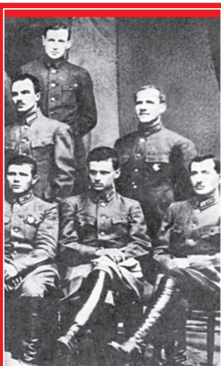
Г.К. Жуков (во втором ряду справа) на Курсах усовершенствования командного состава.

Обвинения в излишних потерях, вообще говоря, не редкость в отношении военачальников любого уровня. Однако последнее время именно Г.К. Жуков оказался под прицелом критики, далеко не всегда конструктивной. На мой взгляд, у этого яв-