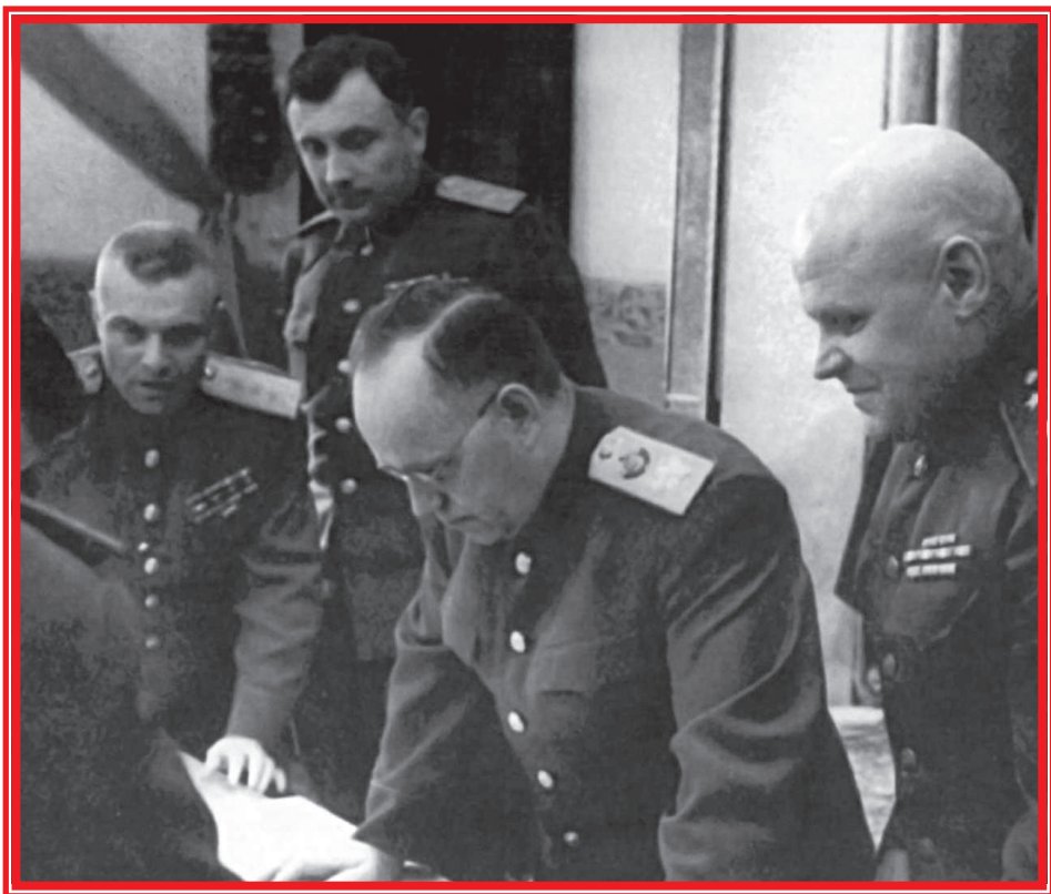
Жуков над картой. 1945 г.

«искусством», а не «наукой» или «ремеслом». Деятельность полководца во многом носит творческий характер. Широко известна фраза, приписываемая итальянскому скульптору Микеланджело Буонарроти: «Я беру глыбу мрамора и отсекаю от нее все лишнее». Если в случае скульптора «лишнее» более-менее ощутимо и понятно, механизм действий полководца куда менее очевиден. Генерал смотрит на мешанину специальных символов на расстеленной на столе карте и подобно Микеланджело, увидевшего в мраморной глыбе фигуру юноши, видит на карте контуры будущего сражения. При этом обычный человек, писатель или даже историк далеко не всегда может понять, что именно показывают разноцветные стрелочки и «реснички», нанесенные поверх лесов и дорог на карте.