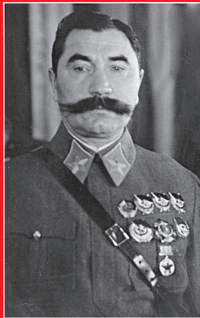
Маршал Советского Союза С.М. Буденный