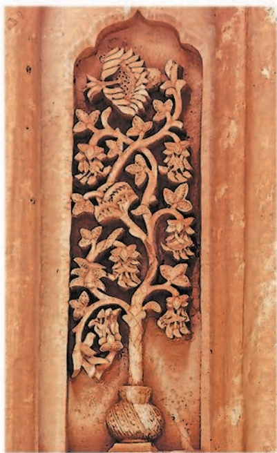
Мировое дерево в культуре разных народов