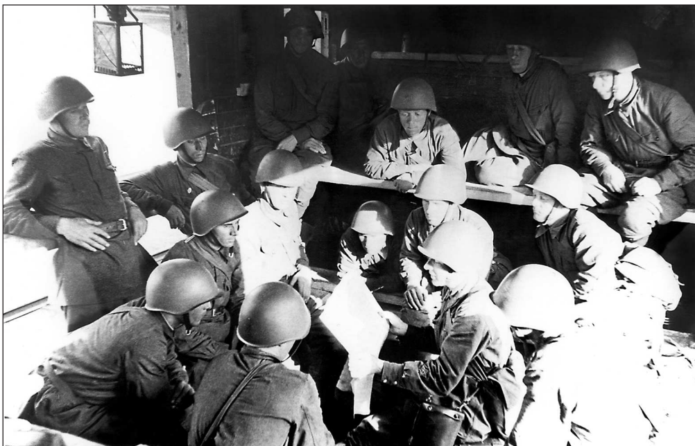
Красноармейцы 30-й армии отправляются на фронт. 30 А была сформирована из личного состава пограничных и внутренних войск НКВД СССР. Западная часть России, июль 1941 года (АВЛ)

вить продвижение наступающих немецких войск и обеспечить условия для перехода в контрнаступление. Основное внимание оно по-прежнему уделяло наиболее опасному — западному — направлению. Действовавшим на нем войскам Западного фронта была поставлена задача: не допустить прорыва немцев на Москву, а для этого предстояло не только в кратчайшие сроки завершить сосредоточение и развер-