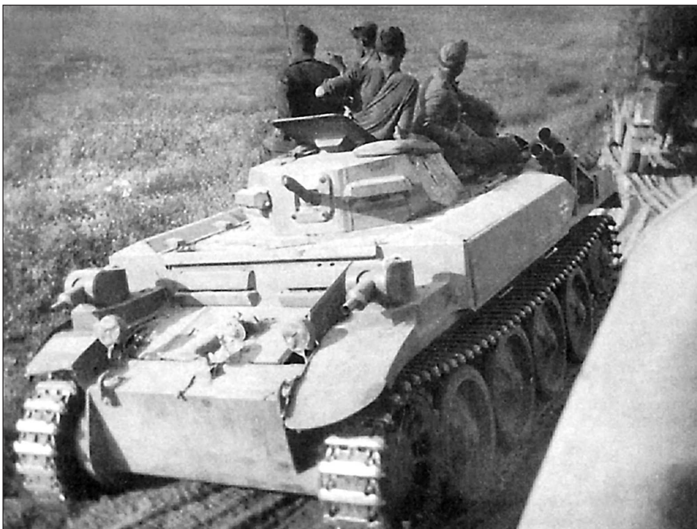
Огнемётный танк Pz.Kpfw. II (F) (Sd. Kfz. 122) из состава 3-й роты 100-го огнемётного батальона. 2-я танковая группа, июль 1941 года