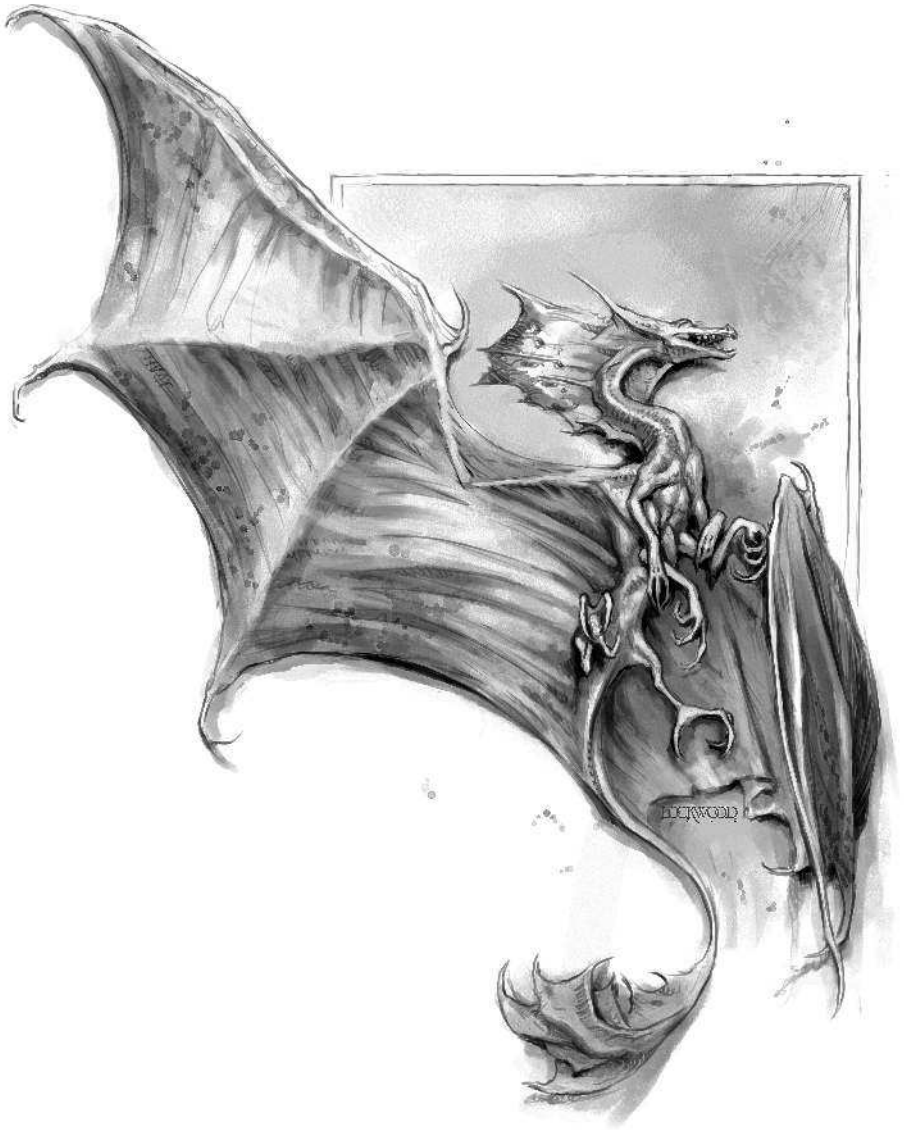
Искровичок (в натуральную величину)