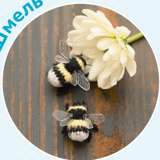
Шмель ■ 47