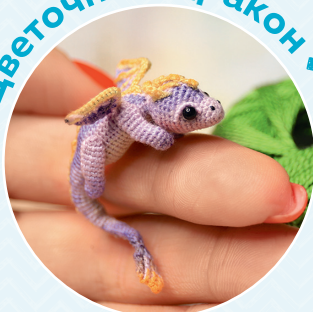
Цветочный дракон ■ 105