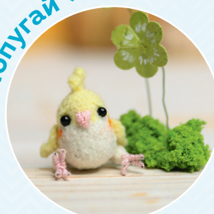
Попугай ■ 87