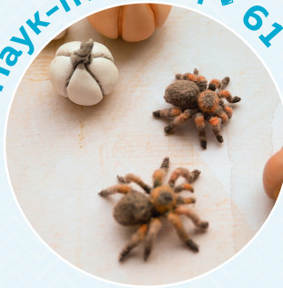
Паук-птицеед ■ 61