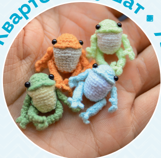
Квартет лягушат ■ 73