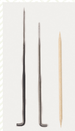
Иглы для валяния, зубочистка